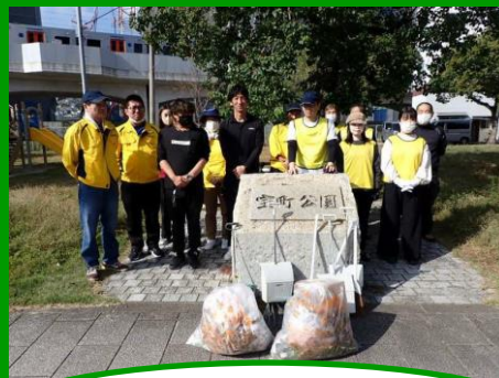
公園の清掃をしている 株式会社 星野組さん