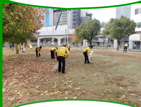
歩道のごみ拾いをしている ビッグ・ワン皆援隊さん