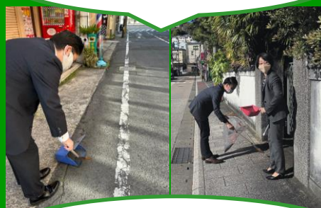
歩道の落ち葉を清掃している 株式会社 田浦組さん