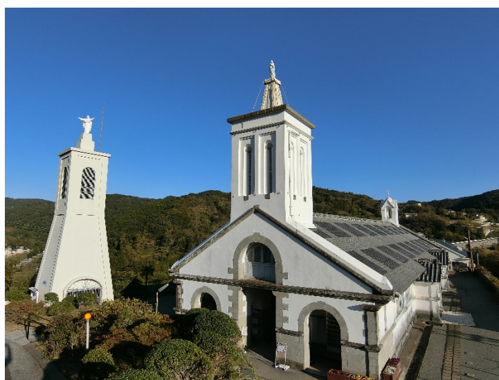
長崎市外海 出津教会堂（国指定重要文化財）