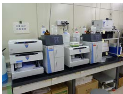
イオンクロマトグラフ装置 （無機化合物）