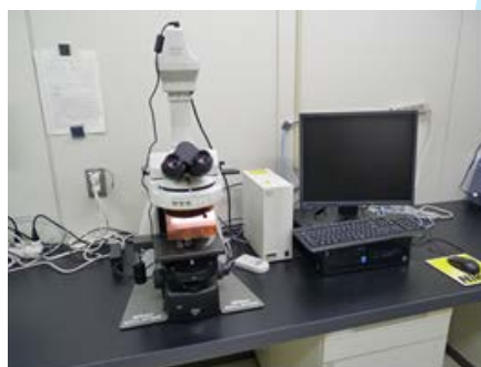
蛍光微分干渉顕微鏡 (藻類、病原性原虫等の検査)