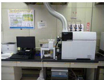
ICP質量分析装置 (金属類の分析)