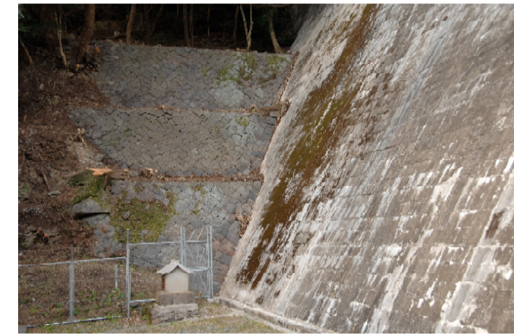
⑩【低部堰堤右岸石積三段】