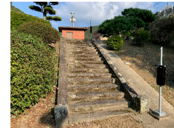
⑥【高部配水池南側の石段】