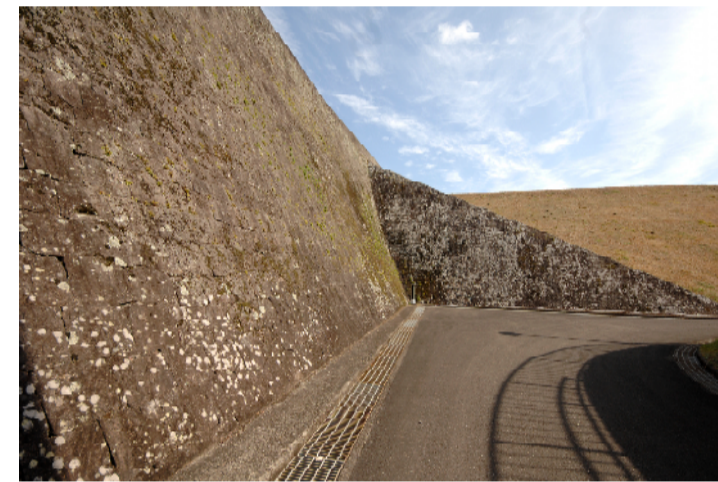
③【下流側旧放水路石垣】