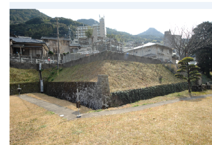
⑤【高部配水池南側の石垣】