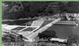
長崎の近代水道の原点ともいえるのが本河内高部ダム。当時の設計や施工技術が集約されていて、近代化遺産としての国の重要文化財にも指定されているぞ。