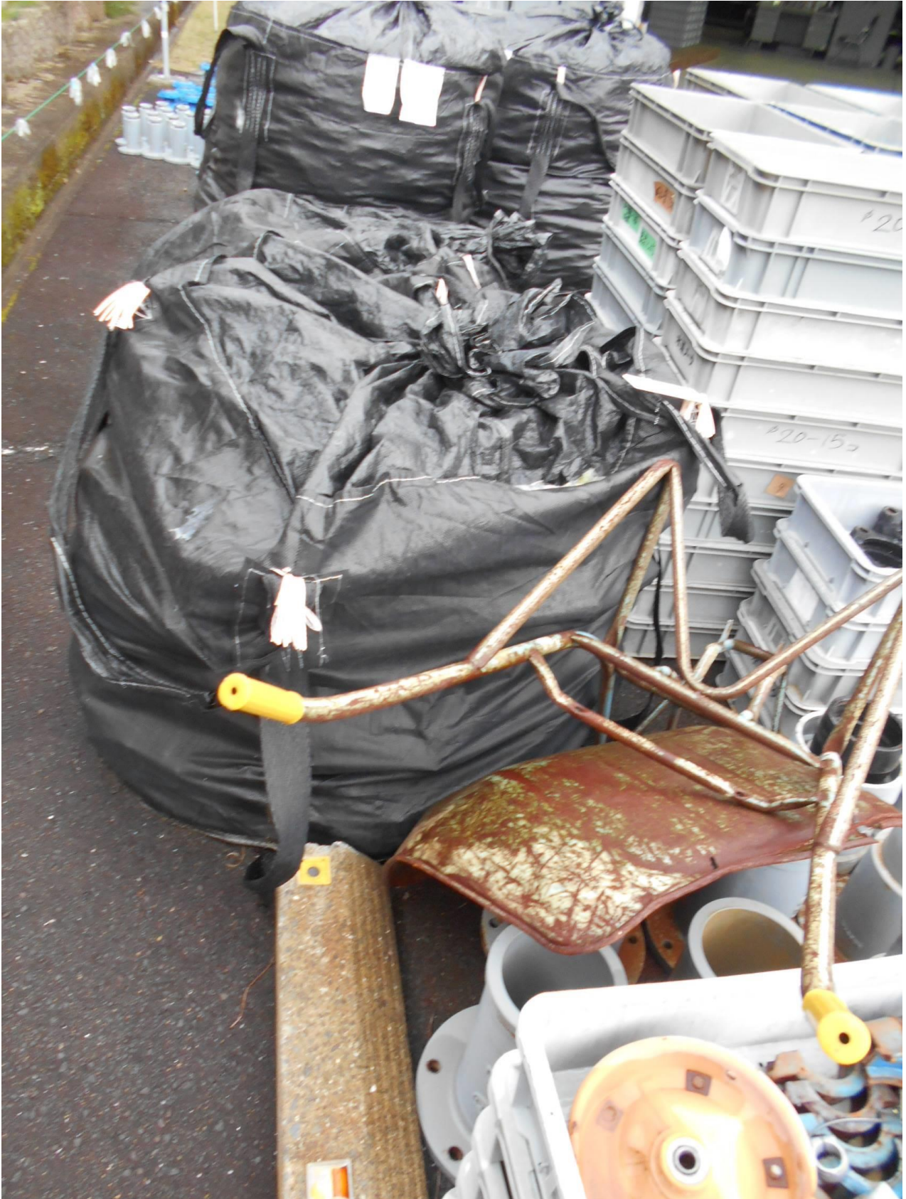
【鉄屑】 東長崎資材倉庫