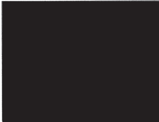
地元周辺の子供達のラジオ体操風景

参加者は顔馴染みの子供達が多いため、毎年、 一学年進級するたびに元気よく挨拶や会話な どが出来るように成長しています。 今年のラジオ体操は8月29日(木)までの予定 でしたが、大型台風10号発生により雨のため 中止しました。 最後に、毎年スタンプ押しなど、ご協力頂い ている [黒]様、[黒]様、[黒]様、[黒]様有難う ございました。また、手作りの竹とんぼを毎年 プレゼントして頂く [黒]様有難うございま した。