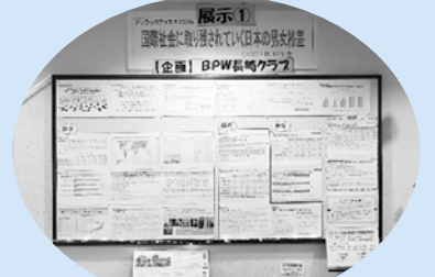
展示「国際社会に取り残されていく日本の男女格差—GGGIは121位」

長崎の女性団体による講座「宗教による性暴力・人権侵害を考える学習会」、DV加害者更生プログラムを体験する「DVをやめたい男性が変わるためのプログラム体験入門」も開催されました。