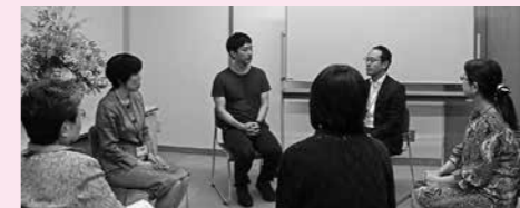
インタビューの様子 (長崎市男女共同参画推進事 業企画ボランティアの皆さん)

最近では「イクメンブルー」なんて言葉も出 てきています。そもそもイクメンを推進し ているのに社会自体が変化しておらず制 度もしっかりと整備されていません。真面 目に仕事もイクメンも頑張っている人ほど イクメンブルーになっています。 無理せず 気を抜くことが大切です。