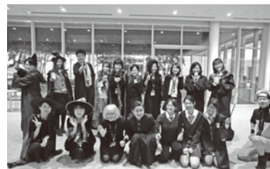
和気あいあいとして働きやすい職場です (ハロウィンの様子)

定期的に現場の社員の声の聞く機会を設けるなど、気軽に話ができる風通しのよい職場環境。