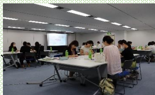
【女性活躍推進グループ会議の様子】