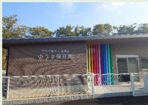
【企業主導型保育園「ゆうき保育園」】