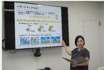
【女性技術者活躍の様子】