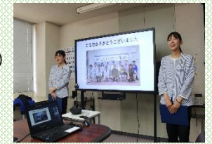
【若手女性による研修報告】

令和 5 年度に 2 名の女性が技術職として採用されており、「女性の採用人数を 1 人以上増加させる」という目標を達成している。管理職に占める女性労働者の割合 4.3% (産業分類「建設業」の国の平均 3.1%) 女性活躍推進企業 (えるぼし) (厚生労働大臣認定) 3つ星認定 (令和 3 年度)