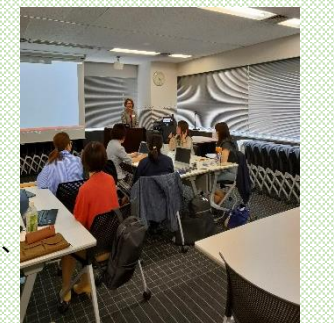
【女性役職者ワーキングの様子】

次期役職候補者向け選抜研修や女性役職者コミュニティ(ワーキング)、ダイバーシティカフェの実施、公認資格や通信教育の受講費補助など、従業員の能力活用に関する取組みを行っている。女性活躍推進企業 (えるぼし) (厚生労働大臣認定) 3つ星認定 (令和 4 年度)