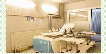
【業務改善のため導入した福祉器具】

女性活躍推進法に基づく一般事業主行動計画 (従業員 100 名以下は任意) を任意策定しており、「従業員全体の残業時間 (平均) を 2 年で 5%、5 年で 10% 削減」という目標を達成している。管理職に占める女性労働者の割合 56.3% (産業分類「医療・福祉」の国の平均 41.8%) 女性活躍推進企業 (えるぼし) (厚生労働大臣認定) 3つ星認定 (平成 30 年度)