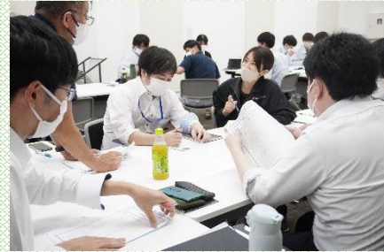
【活性化コミュニケーション研修の様子】