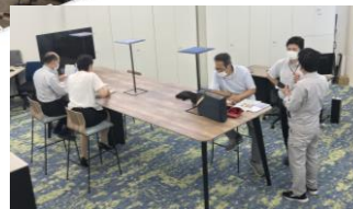
立ち会議スペース