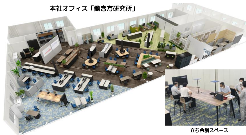
本社オフィス「働き方研究所」

また、本社オフィスリフォーム時に、社員アンケートを実施し、その意見を反映させるなど、働きやすい職場環境が整備されており、リフォーム後の本社オフィスを「働き方研究所」として、そのノウハウを地元企業に提案している。