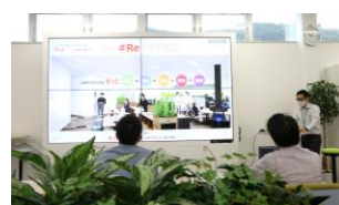
プレゼンコーナー