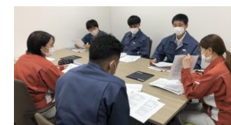
さまざまな現場で 女性技術職が活躍しています。

⇒平成 4 年 4 月現在、9 名の女性技術職が在籍しており、目標を達成している。