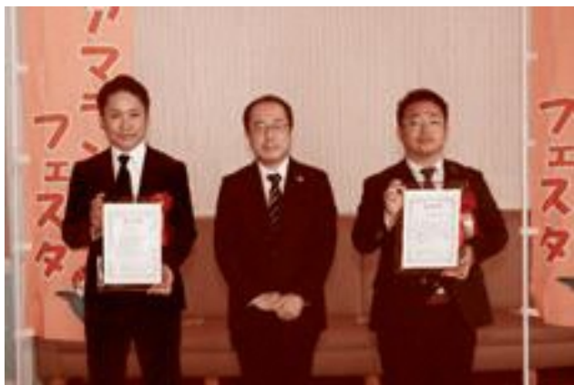
【左から】株式会社イシマル 様、武田副市長、株式会社西海建設 様