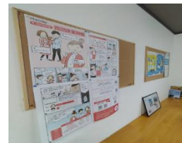
【掲示による情報提供】