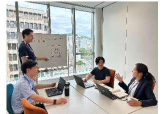
【ミーティングの様子】