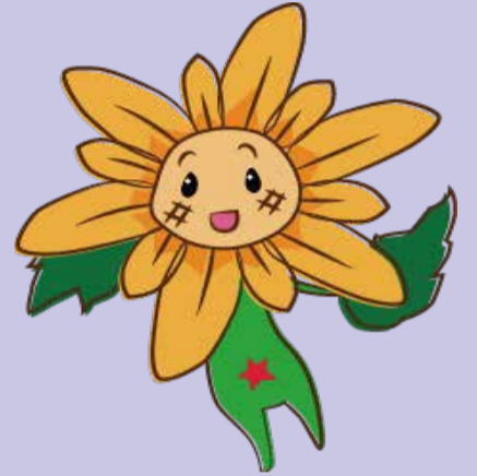
長崎人権イメージキャラクター ヒマワリさん