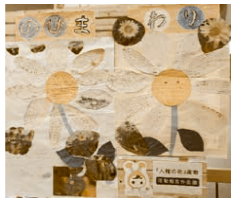
人権の花運動の成果物掲示の様子

人権擁護委員について、皆さん知っていますか？ 人権擁護委員は、法務大臣から委嘱された民間の人たちで、地域の皆さんの人権相談や問題解決のお手伝いをしたり、人権侵害の被害者を救済したり、地域の皆さんに人権について関心を持ってもらえるような啓発活動を行っています。