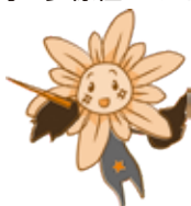
長崎市人権イメージキャラクター ヒマワリさん

人口の8～10%位は性的少数者と言われていて、左利きの人と同じ位の割合となっているよ。