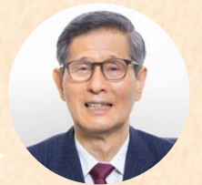
新型コロナウイルス 感染症対策分科会会長

差別や偏見、嫌がらせが広がると医療従事者やエッセンシャルワーカーの離職が増える可能性があります。また、感染者への同様のことが増えると検査を避けたり、感染を隠そうとする人が増え、感染拡大を抑えにくくなります。