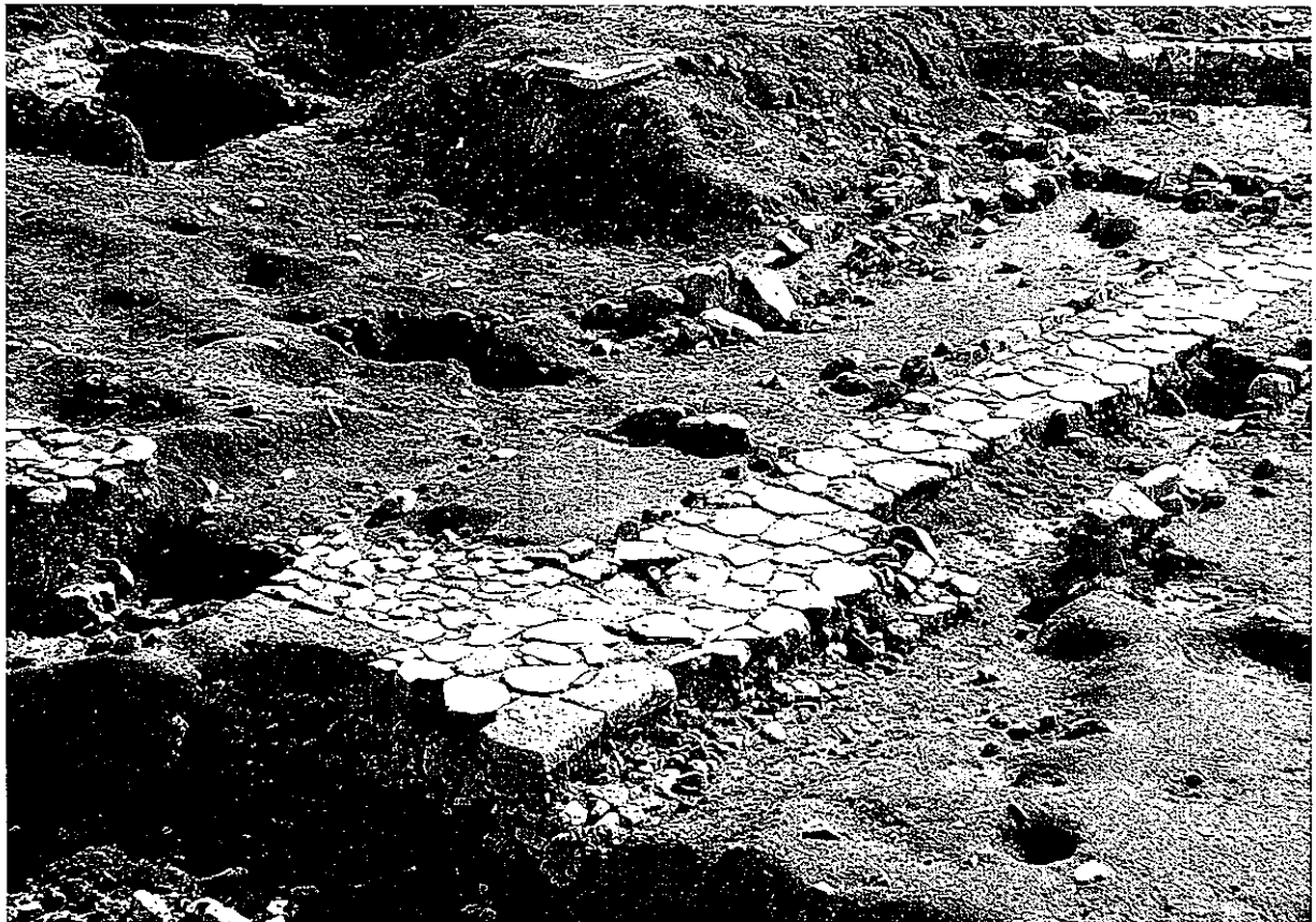
勝山町遺跡で発見された石畳(教会時代)

発行日 平成16年5月28日 発行所 長崎市魚の町5-1 長崎市教育委員会 生涯学習部文化財課 TEL 829-1193