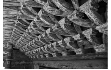
四手先三葉拱斗拱

創建は寛永21年(1644)ですが、現在の門は元禄9年(1696)に再建されたものです。改築の際元禄7年(1694)に寧波 ニンポー で広葉杉 こうようぎん の木材が切組まれ、翌年数隻の船に分けて舶載され、当地で再建されました。