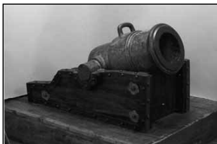
モルチール砲 天保6年(1835) 武雄市教育委員会所蔵

高島流の代表的砲種。山頂や城内など直視できない目標に対し、近距離から45度以上の曲射弾道で発射。大型榴弾・焼夷弾・照明弾用。他にもホーイツスル砲、野戦砲等を長崎から江戸に持ち運び演習を行いました。