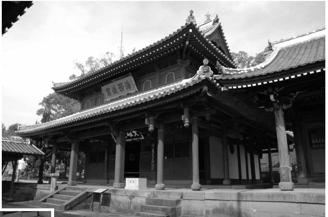
崇福寺大雄宝殿（国宝）