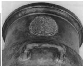
モルチール砲(部分) 抱き銀杏家紋象嵌 武雄市教育委員会所蔵