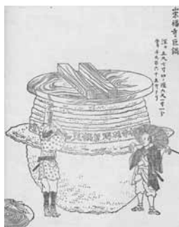
「大釜」『長崎名勝図絵』

萬人鍋とか済貧鍋とも呼ばれる、深さ約 1.73m、直径 約1.86mのこの巨大な釜は、天和2年（1682）に鍛冶屋町より車に乗せて運び入れ、大雄宝殿前に据え付けられ、一度に米 630kg（約4石2