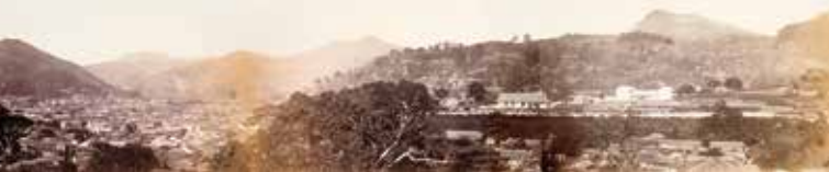
長崎全景

長崎(小島)養生所是在龐貝希望修建醫院的這一請求下於1861年修建的,是日本最早的近代西式醫院。養生所建在長崎村小島鄉字佐古的山丘上,該地位於長崎郊外,陽光明媚、通風良好、空氣清新、地勢高。龐貝等一群荷蘭人參照荷蘭的軍醫院設計了養生所的建築,並引進西洋設備。另外,還修建了醫學所。龐貝在醫學所開展從基礎到臨床的係統化的近代醫學教育。