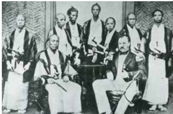
龐貝(前排居中偏右)和鬆本良順(前排居中偏左)

1862年龐貝完成預定的所有課程後返回了荷蘭。5年的任期裏, 龐貝為日本醫學和醫療的發展做出了卓越的貢獻, 培養了眾多人才, 因此他被稱為日本近代西洋醫學教育之父。