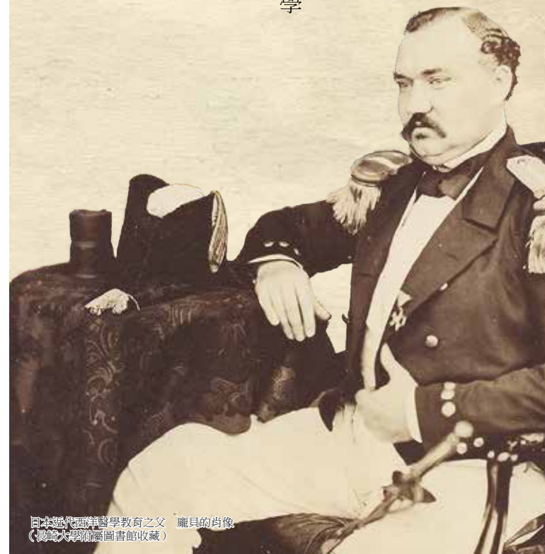
日本近代西洋醫學教育之父 龐貝的肖像