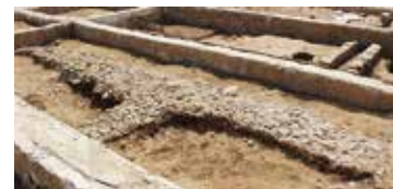
養生所建物の基礎遺構

長崎海軍伝習所の誕生から、養生所やその関連施設が設置された経緯などを紹介。また、養生所北棟の基礎遺構を露出展示しています。