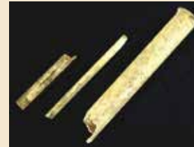
▲試験管など(ヨーロッパ製)