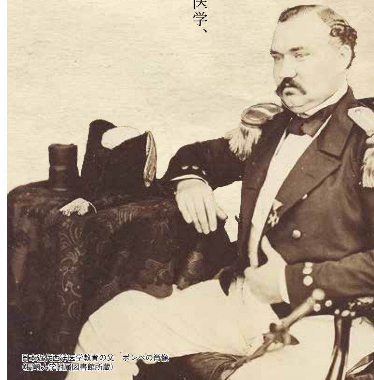
日本近代西洋医学教育の父 ボンベの肖像 (長崎大学附属図書館所蔵)