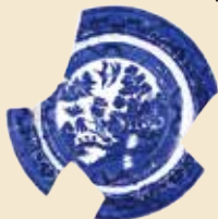
西洋皿 (オランダ製)