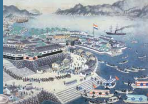
ボンベ肖像画(個人所蔵、シーボルト記念館寄託) 長崎海軍伝習所絵図(部分) 公益財団法人鍋島報効会所蔵