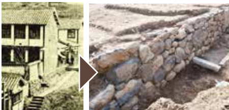
小島養生所の古写真(「松香遺稿」所収)

小島養生所跡から出土した石垣遺構を露出展示するとともに、出土遺物や分析研究所遺構を紹介。さらにVRで当時の建物の外観・内観を再現します。