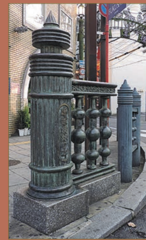
歓楽街「銅座」の入口にある思案橋の記念碑

日本中にその名が知られる「思案橋」また、その周辺の歓楽街「銅座」は長崎の夜のまちの代名詞。あらためてその歴史を知ると、いつものネオンがさらに輝いて見えるかも。