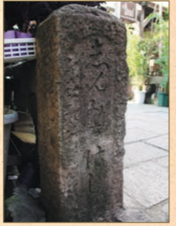
西濱町築地と築地銅座を結ぶ橋として架けられたと考えられる「新道橋」。現在の橋は石橋で1916年(大正5)に架けられたものです。

また、船大工町や籠町から山手に上る細い坂道も昔ながらの面影を残しています。思わず手をあわせたくお堂やお地藏さん、のんびりと歩く尾曲がりネコなどに会おうと、心がほっこり温かくなります。