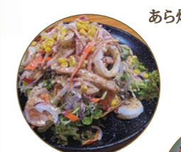
長崎サラダ 血うどんのパリパリ麺を生野菜とドレッシングで!

鯨 長崎県は昔から鯨の宝庫。今では高級品となった鯨も長崎では気軽にいただけます。