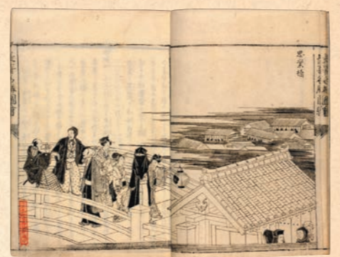
「長崎名勝図絵」より(長崎歴史文化博物館蔵)

思案橋は、その花街丸山の入口にあり、「丸山で遊ぼうか、どうしようか」と迷いながら思案橋を渡り、思切橋で決心して丸山の遊女のもとへ。そして帰りは、思切橋の上で遊女への未練を断ち切りながらも、見返り柳の下で丸山を振り返りながら家に戻ったという、語り伝えのある場所です。