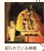
祀られている神様 土神(→詳細裏面)