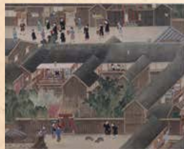
石崎融思「唐館図 唐館図 蘭館図 絵巻」/長崎歴史文化博物館蔵

唐人屋敷には滞在するための長屋が20棟近くあり、すべて2階建てでした。造りも立派で眺めの良い2階の部屋には船主や会計係など身分の高い人が住み、1階は大部屋で船員が滞在していました。写真上部の行列は、長崎ランタンフェスティバルで再現されている媽祖行列の風景で、この通りは土神堂から天后堂へ続く300年の歴史の道です。