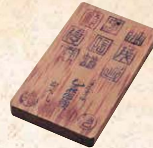
門鑑(鑑札)天保10年(1839)/長崎歴史文化博物館蔵

日本人が唐人屋敷に出入りする時は、門鑑(通行許可証)が必要でした。写真の門鑑は、天保10年(1839)に唐人屋敷数名が発行したものです。唐人屋敷の大門と二ノ門の間には広場があり、宝永5年(1707)以降、魚や野菜などの日用品の他、漆器や伊万里焼などを並べたお店が設けられました。この門鑑は、ここでの商売を許可された商人たちに発行されました。ほかにも普請(工事)等で出入りする職人や二ノ門の先まで入ることができた遊女にも発行されました。