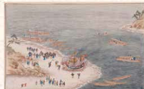
川原慶賀「唐蘭館絵巻」より「彩舟流し」/長崎歴史文化博物館蔵

中国の「彩舟(さいしゅう)流し」は、お供え物で飾った唐船の模型を燃やし、亡くなった人々を供養した行事。彩舟流しは明治以降に廃止されましたが、長崎でお盆の8月15日に行われる精霊流しは、この彩舟流しが原形といわれています。