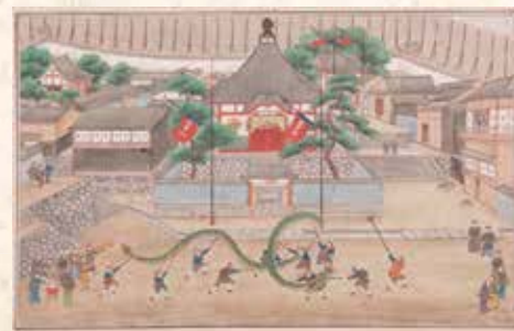
川原慶賀「唐蘭館絵巻」より「龍踊図」/長崎歴史文化博物館蔵

唐人屋敷で上元(正月15日)に行われていた祈福の祭り。この龍踊りを唐人屋敷に隣接する籠町の町民が習い、現在、長崎くんちの奉納踊「龍踊り」として伝えられています。