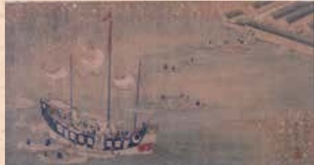
石崎融思「唐船入津丸荷役之図」/長崎歴史文化博物館蔵

長崎への唐船の最初の来航は永禄5年(1562)という伝承があります。元亀2年(1571)にポルトガル船が入港し、長崎の町建てが始まると、やがて唐船も多く来航するようになりました。江戸時代に入ると、ポルトガル貿易とともに中国貿易が盛んに行われるようになり、寛永11年(1635)には、唐船の入港が長崎に限定されました。鎖国時代の長崎では、ポルトガルに代わったオランダ貿易が開始され、両者を比べると、中国貿易の収益がおよそ2倍もあったので、長崎の景気は、唐船が何隻来航したかどうかに大きく左右されていました。また、貿易を円滑に行うために、貿易現場での通訳や外交文書の翻訳などを行う「唐通事(とうつうじ)」と呼ばれる人たちが活躍しました。なお、長崎では中国を唐、中国人を唐人といいます。