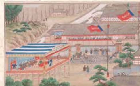
川原慶賀「唐蘭館絵巻」より「観劇図」/長崎歴史文化博物館蔵

土地神の誕生祭で行われていた唐人踊。月琴や笛、銅鑼(どら)、喇叭(らっぱ)などの楽器の演奏に合わせて演技していました。また、中国から伝わった音楽「明清楽(みんしんがく)」は、今も長崎の伝統として受け継がれています。