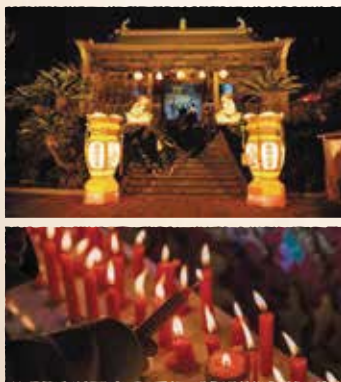
長崎ランタンフェスティバルの唐人屋敷会場

長崎ランタンフェスティバルは、元々長崎の華僑の人たちが、中国の旧正月（春節）を祝うための行事として新地中華街を中心に開催していた祭りです。平成6年から規模を拡大し長崎の冬を彩る一大風物詩となりました。期間中は、メイン会場の湊公園や新地中華街はもとより、浜市・観光通りなどの市内中心部に、約1万5千個にも及ぶランタン（中国提灯）が飾られます。唐人屋敷跡では、「ロウソク祈願四堂巡り」等が行われ、多くの人で賑わいます。