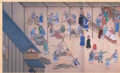
作者不詳「唐館図」/長崎歴史文化博物館蔵

大門と二ノ門の間の広場では中国人たちが、長崎市中の商人から日々の食材や燃料の薪などを購入しました。ニワトリ・アヒル、魚類、大根も売られていました。銅器の販売・購入は貿易そのものです。ここは中国人と長崎人の交流の場だったのです。