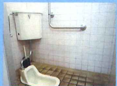
▲女性用・和便器右側

女性用の個室は全部で6カ所あるが、全部着座(しゃがむ)して壁側にL型手すりが設置してある。