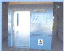
▲多目的トイレの出入り口