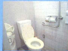
▲女性用・洋便器左側