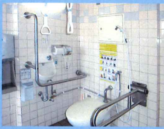
▲多目的トイレの内部