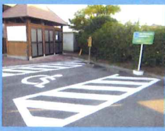
▲障害者専用の駐車場