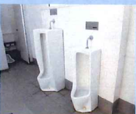
▲男性用トイレの小便器