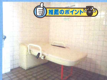
▲多目的トイレのユニバーサルシート