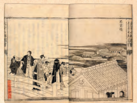
「長崎名勝図絵」より(長崎歴史文化博物館蔵)

思案橋は、その花街丸山の入口にあり、「丸山で遊ぼうか、どうしようか」と迷いながら思案橋を渡り、思切橋で決心して丸山の遊女のもとへ。そして帰りは、思切橋の上で遊女への未練を断ち切りながらも、見返り柳の下で丸山を振り返りながら家に戻ったという、語り伝えのある場所です。