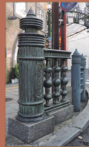
歓楽街「銅座」の入口にある思案橋の記念碑

日本中にその名が知られる「思案橋」また、その周辺の歓楽街「銅座」は長崎の夜のまちの代名詞。あらためてその歴史を知ると、いつものネオンがさらに輝いて見えるかも。