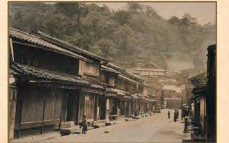
町家が建ち並ぶ風景(明治中期以降)。諏訪町の通りを寺町(長照寺)方向に向かって撮影(写真2)

幕末明治期の長崎は、町家の建物がびっしりと建ち並び、大正初期の「日本都市風景」(椋内吉胤:とちないよしたね著)に「長崎のように同じような古風な格子の家の集団が果てしなく続く風景は見たことがない…」という記述があるほど、その光景は珍しいものだったようです。長崎の一般的な町家は、格子や連子(れんじ)、裏の家へ続く小路(しゅうじ)などがある純和風木造住宅。間口が狭く奥に長いので、敷地の中に庭を作って光や風通しを良くしていました。昔のように連続した町家の並びこそないものの、長崎市には今も約300軒余りの町家が残っています。