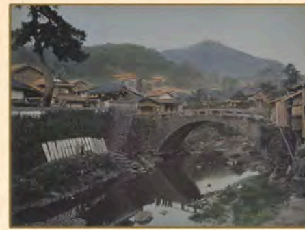
編笠橋のたもとで紙すきをする風景。江戸時代はじめて中島川沿いに紙すき職人が多く住み着いたため「本紙屋町」という町名がついたといわれる(写真1:長崎大学附属図書館蔵)

その後の町名変更等で懐かしい町名が変わってしまったり、消えてしまったものもありますが、今も、通りや橋名などにその名残があるほか、銀屋町や東古川町など町名復活した町もあります。また、くんちの踊町など、コミュニティは現在にも受け継がれています。