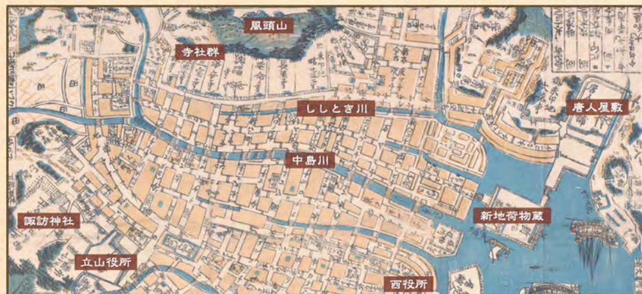
(図2)享和元年(1801)の長崎図(長崎歴史文化博物館所蔵)

眼鏡橋を興福寺の住職が造ったことからわかるように、中島川に架かる石橋は参拝客のために造られました。その門前町として形成され発展してきた現在の中通り商店街は、長崎で一番古い商店街です。