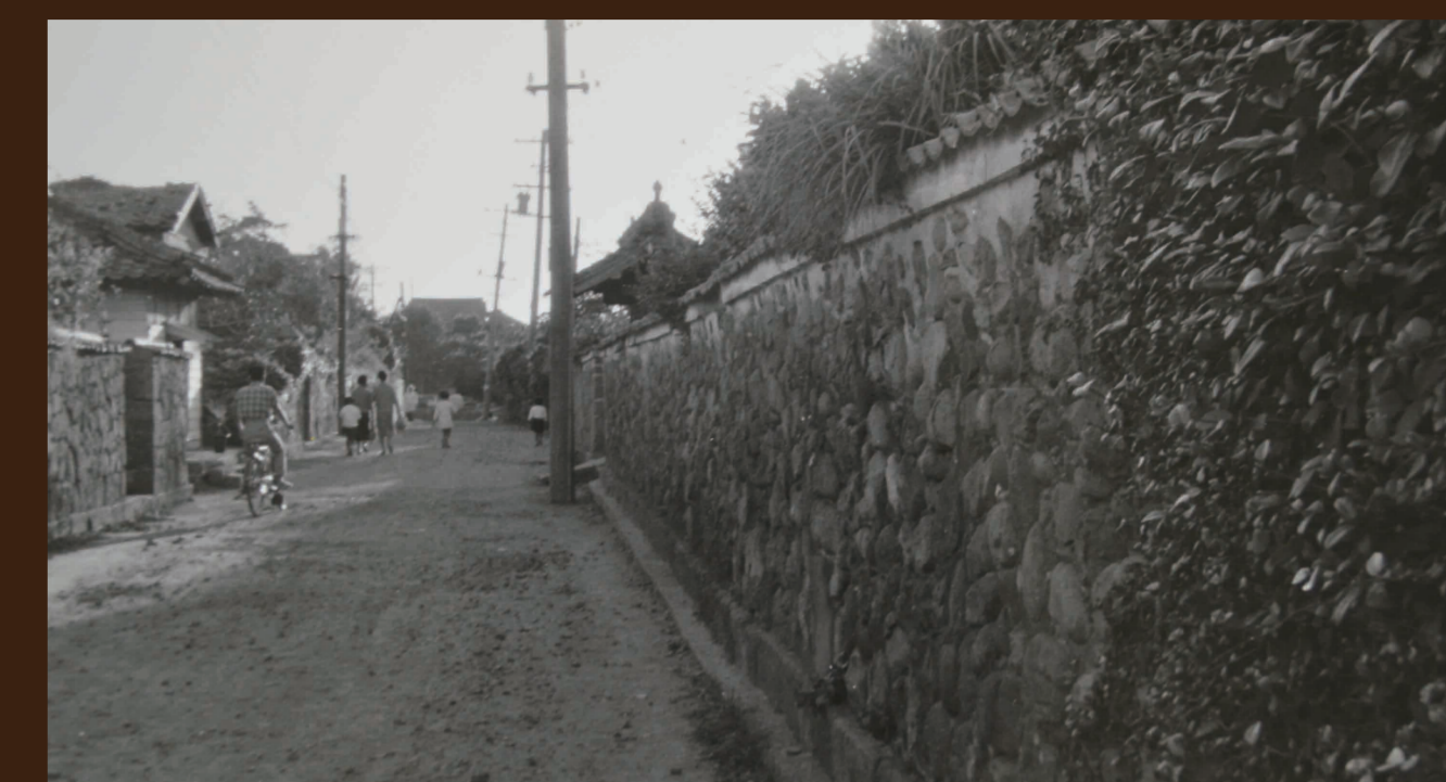
曾经的武将居住区大路