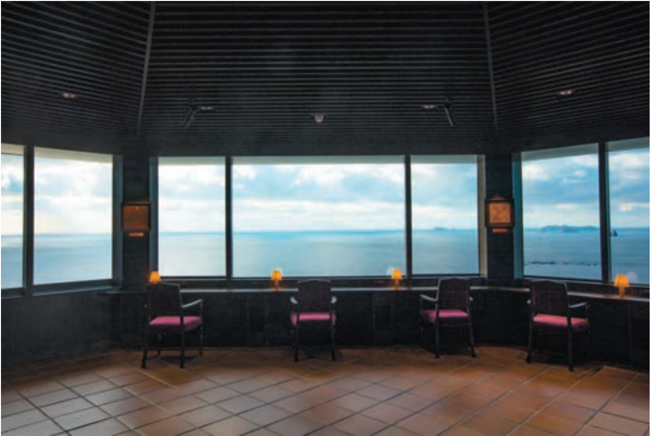
遠藤文学と風景と私だけの空間で、人は自分自身の本音と出会うことができる。