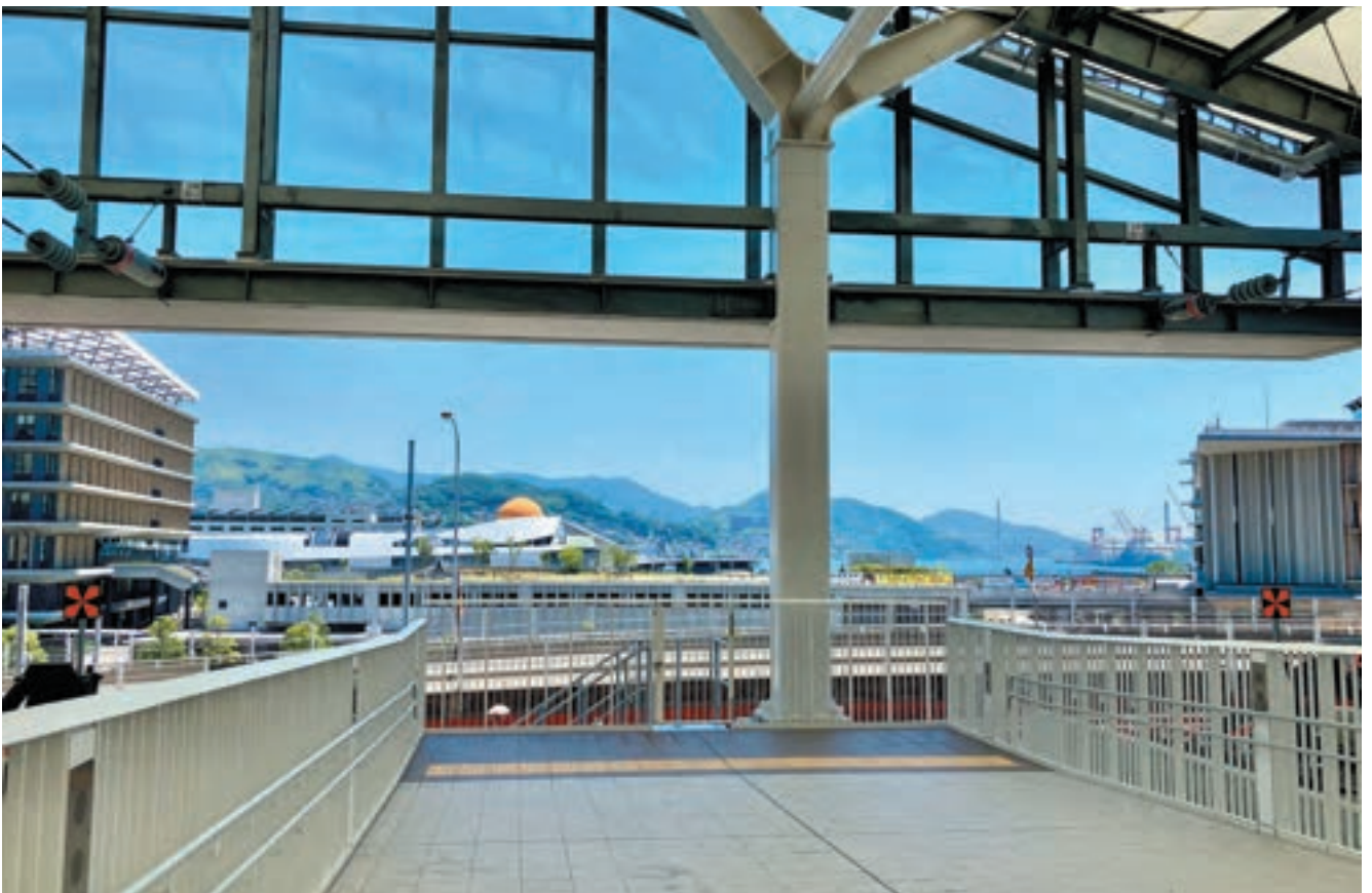
新幹線ホームからは長崎港を望むことができる。新幹線利用者の乗降がないホーム先端（滑走余裕長区間）も一般利用ができるように整備している。また、先行整備された県警察本部（左）と県庁（右）は、長崎県が進めてきたアーバンデザイン会議での協議によって駅正面を避けて建設されていた。