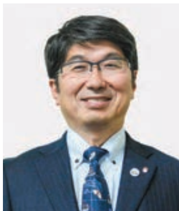
長崎市長 田上富久