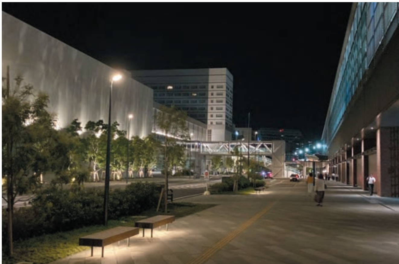
在来線駅舎（右）、いなさ口（西口）駅前広場、西通り線、出島メッセ長崎（左）を、色彩や舗装材、植栽、夜間照明等、様々な点で一体的にデザインしている。