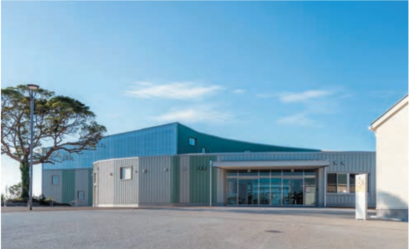
あぐりの丘の環境に馴染む、あたたかい雰囲気を持った建物となるように配置計画や色彩計画について慎重に検討しました。