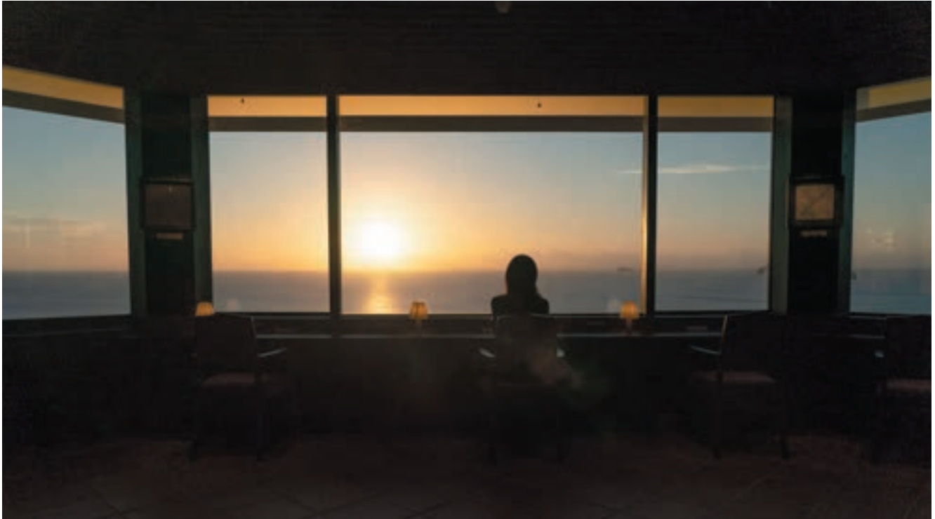
アンシャンテの夕景は感動的。訪れた人も風景の一部になる。