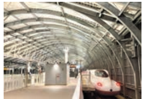
大規模事業の例：長崎駅周辺整備事業

プロジェクトで何を実現するのか（目標）、何を重要視するのか（優先順位）、何を計画や設計の前提とするのか（前提条件）を職員とともに整理しながら、どのような体制とプロセスで検討を進めるのか（体制構築）、計画や設計を行ってもらう腕のよいチームをどう獲得するのか（設計者選定プロセスの企画）等にも取り組み、体制が構築された後は、検討ワーキング座長や検討委員会委員、市民ワークショップの全体ファシリテーション、市民シンポジウムのコーディネーター等の役を担い、プロジェクト全体のマネジメントを行ってきました。関係機関とのデザイン調整や施工現場におけるデザイン監理も行います。良い施設を実現するための「デザインマネジメント」において主要な役割を担っています。