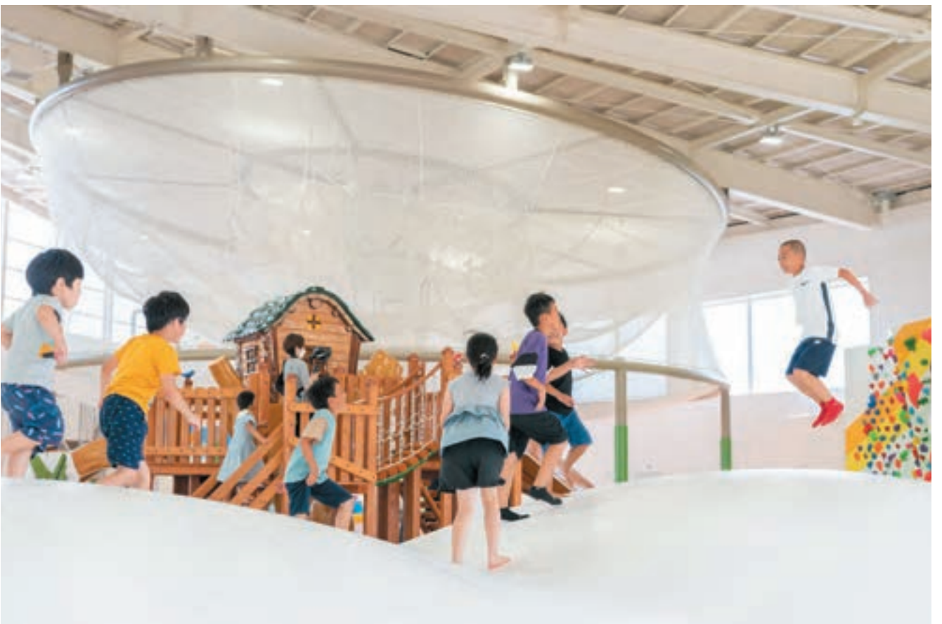
開館以来、こどもたちの笑顔が溢れている。開館22日目で来館者1万人を達成した。