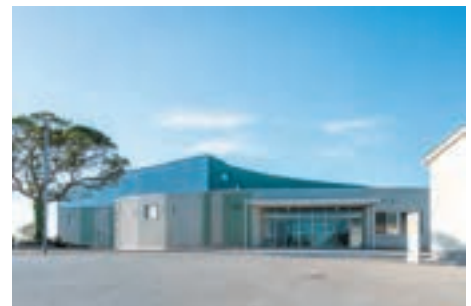
中規模事業の例：あくりドーム

担当課の職員が示す図面や資料、施工現場に対して指導、助言を行いながら、デザインの監修を行っています。協議は会議室だけでなく、現場でも行うことを原則としています。また、夜景やプロダクトデザイン、子育て等の外部専門家と職員との協議を支えるとともに、岩原川プロムナードや深堀ふれあい広場等では市民ワークショップによる検討を行うように指導し、ワークショップのファシリテーションも行ってきました。