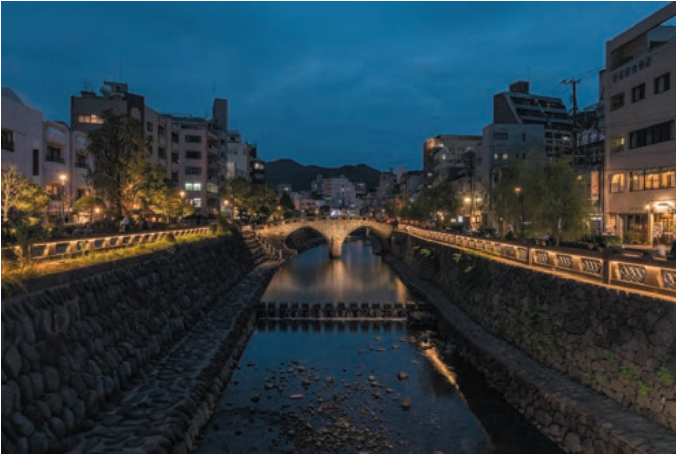
眼鏡橋の夜景