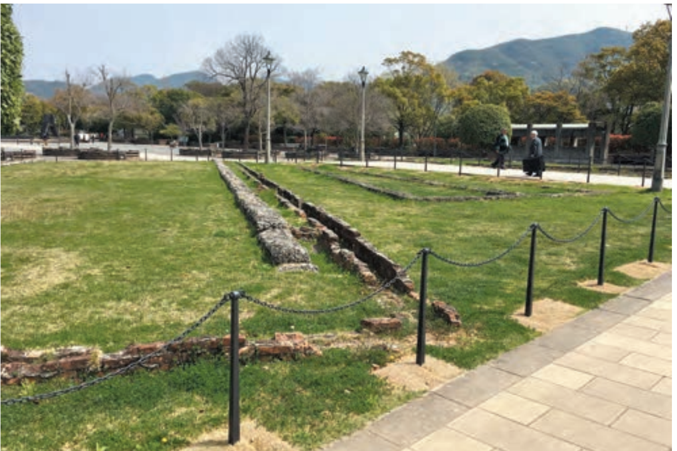
遺構への立ち入りを防ぐ柵についても、遺構や周辺環境との一体性を考慮してデザイン検討した。