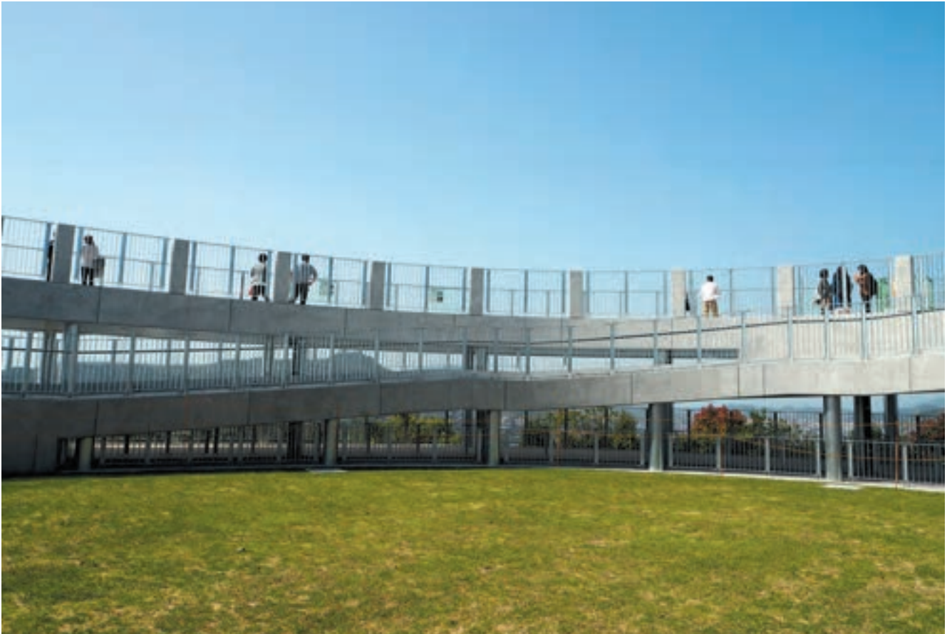
変化があって飽きのこない風景をゆっくりと眺める来園者が増えました。