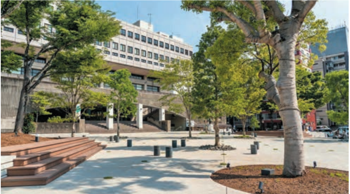
地下駐車場出入口を1箇所撤去する等して、交差点側に開かれた公園とし、立体的に見えるように樹木を配置している。