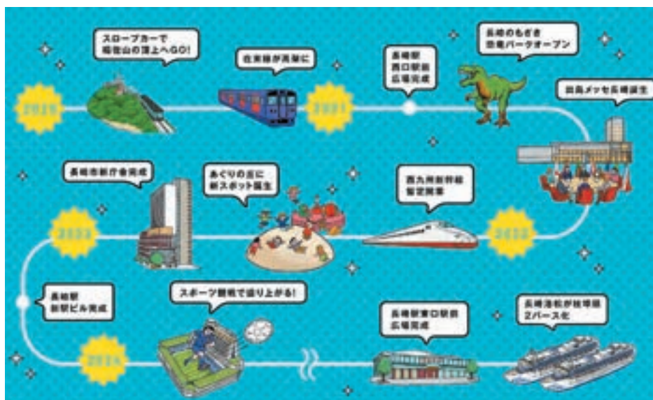
長崎のまちは「100年に1度」の更新時期を迎えている

戦後、高度経済成長期に構築された、これまでの公共事業のやり方をそのまま踏襲するだけではこうした「高次の欲求」には応えられません。長崎市の職員は、予算、時間、基準等の様々な条件を踏まえながらも、ひとつひとつの公共事業を時代の要請にあわせて丁寧に見直していく必要があります。そこで職員を現場で指導する「家庭教師」として、平成25年4月に設置されたのが「長崎市景観専門監」なのです。