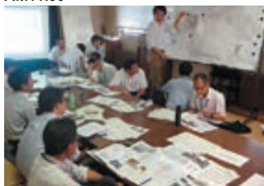
関係課・設計者との協議