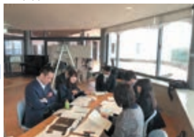
現場での関係課・設計者との協議