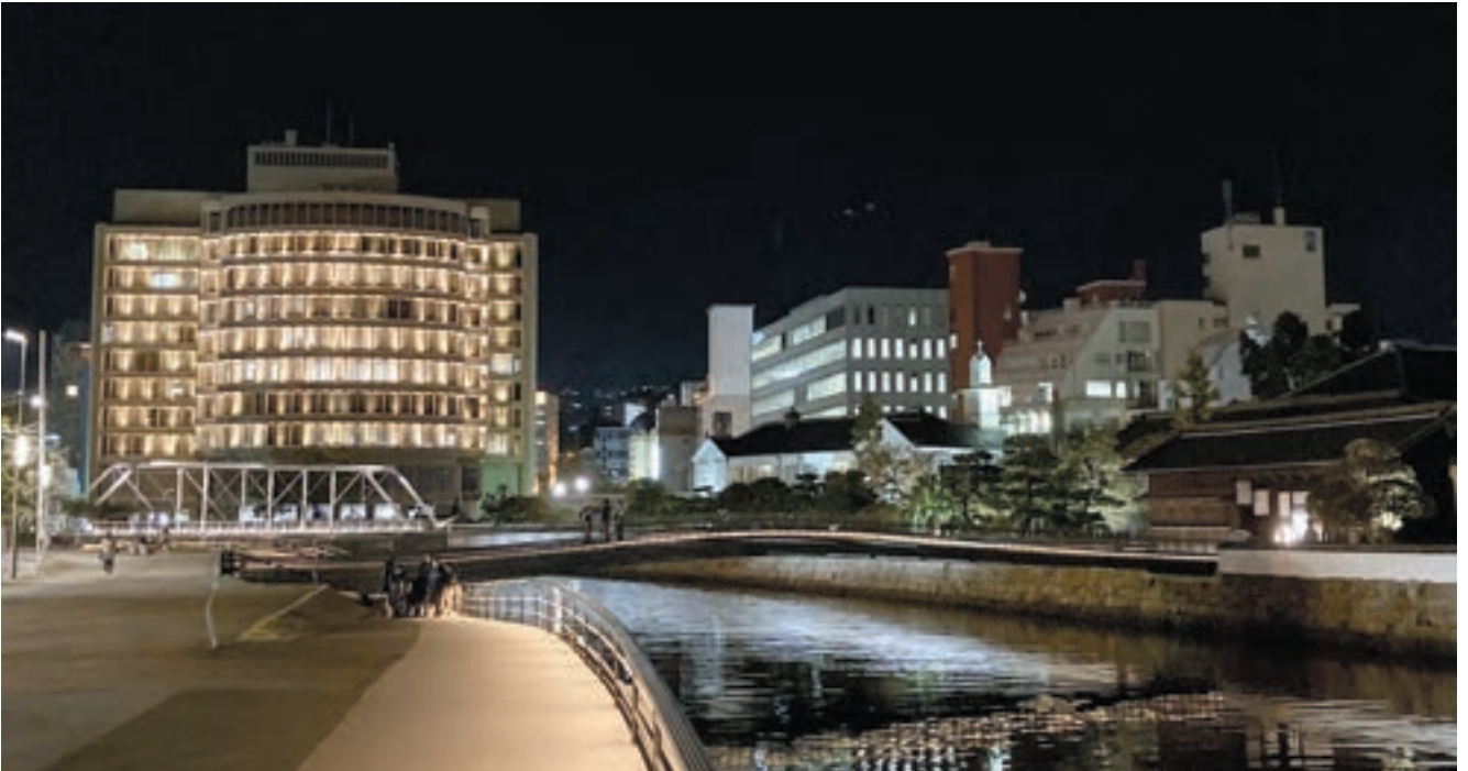
夜間景観もトータルでデザインされている。水辺に誘う優しいあかりをたどっていくと自然と表門橋にたどりつく。