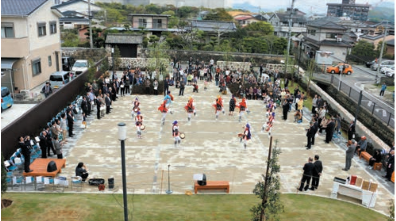
地域主催で開催された完成式典の様子。前夜の雨の影響で舗装がまだら模様になっているが、駐車位置のガイドラインになる舗装が見て取れる。