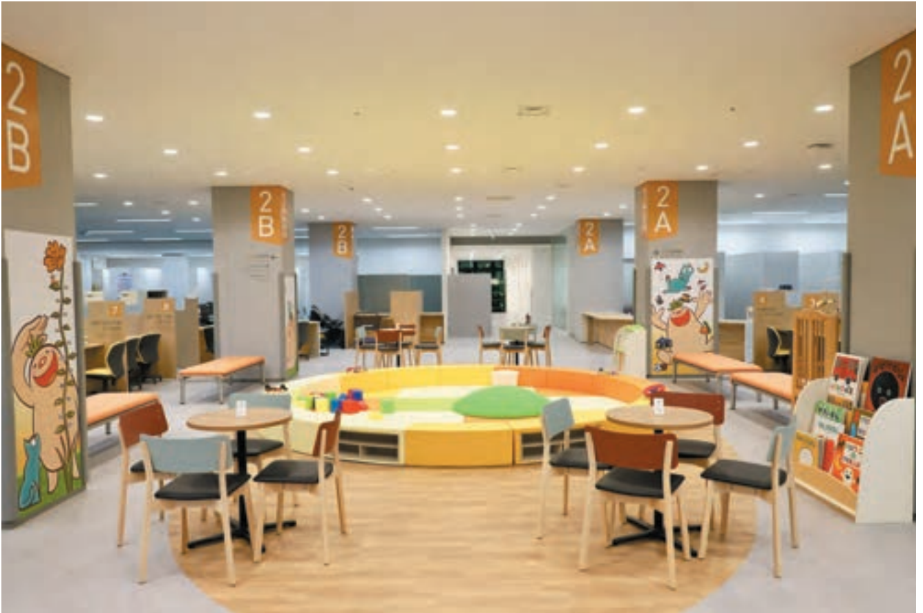
子どもフロアは、手続き時に子どもを近くで見たいという市民意見を反映して、カウンターを円状に、その真ん中に子どもが遊べるスペースを配置した。