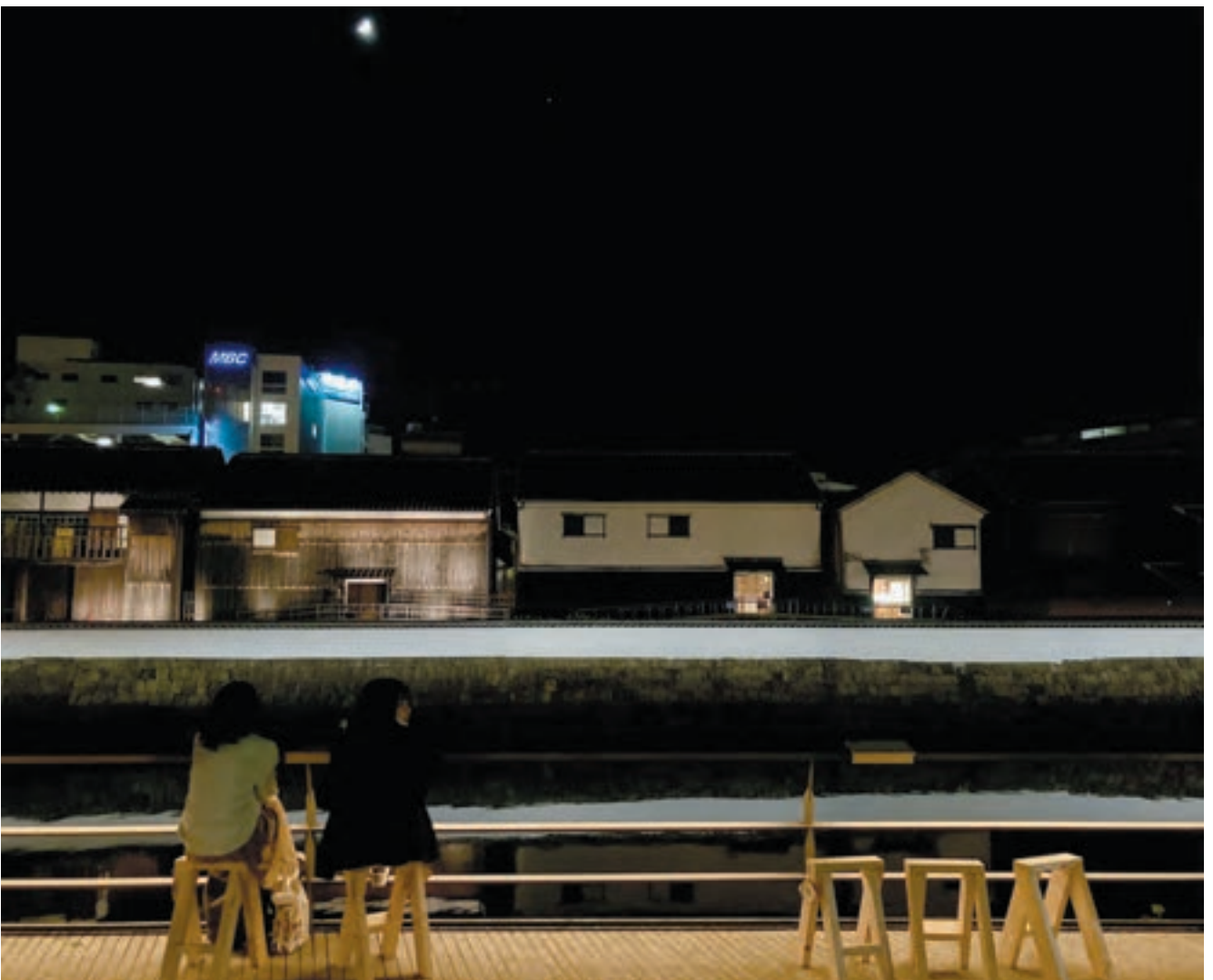
優しいあかりに包まれながら、出島のライトアップとお月様を眺める水辺の風景は、長崎でしか実現できない。