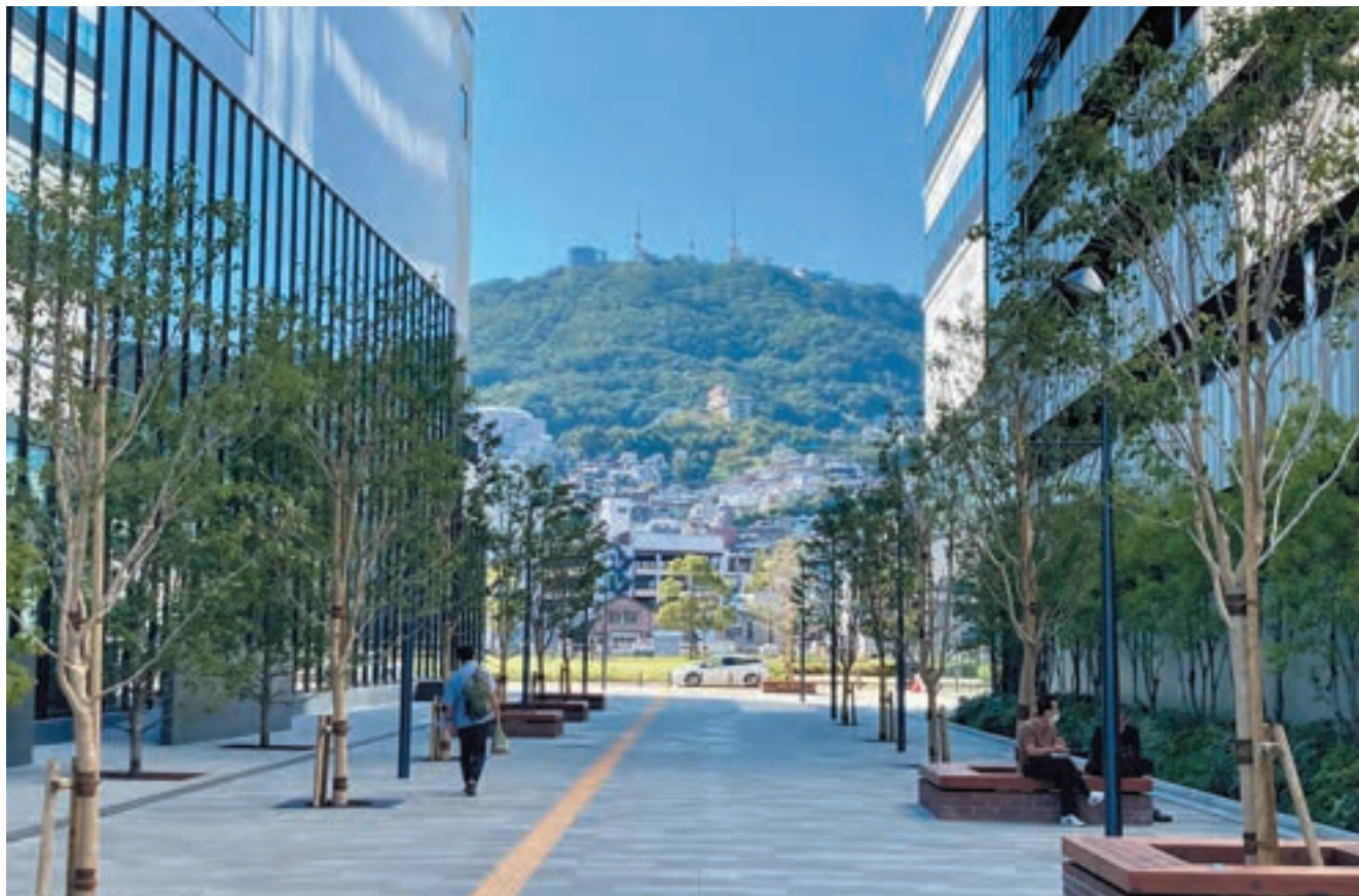
ヒルトン長崎（左）と出島メッセ長崎駐車場（右手前）およびNBC新社屋（右奥）に挟まれた歩行者専用道路でも、稲佐山への眺望を象徴的にみえるように沿道施設との一体的なデザインを実現している。