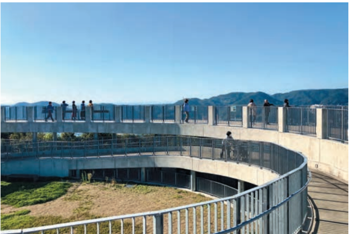
親子連れや高齢者、車椅子の方のお姿を多く見るようになりました。