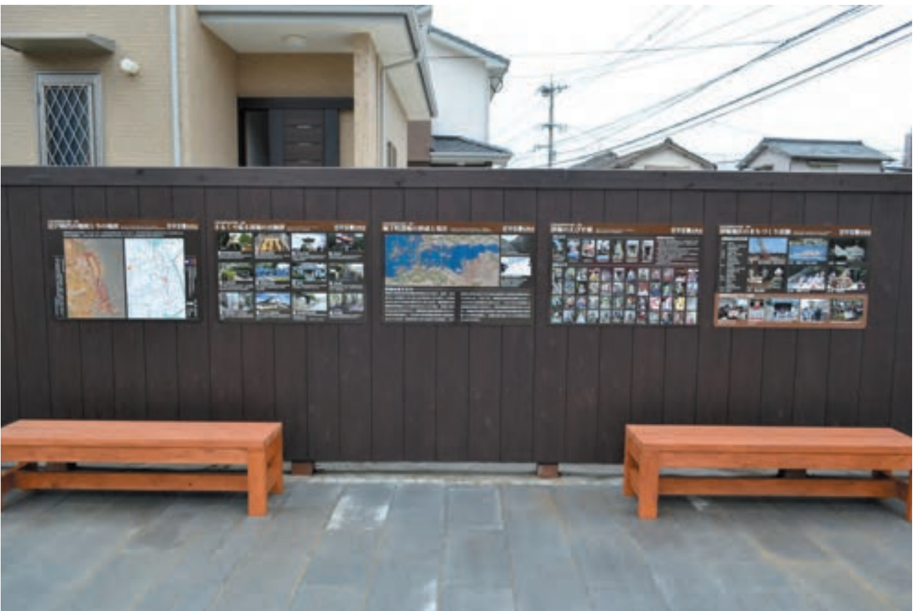
地域ガイドのスタート地点として広場を活用できるように広場を囲う塀に設置した地域情報パネル。手前は地域住民で塗装したベンチ。