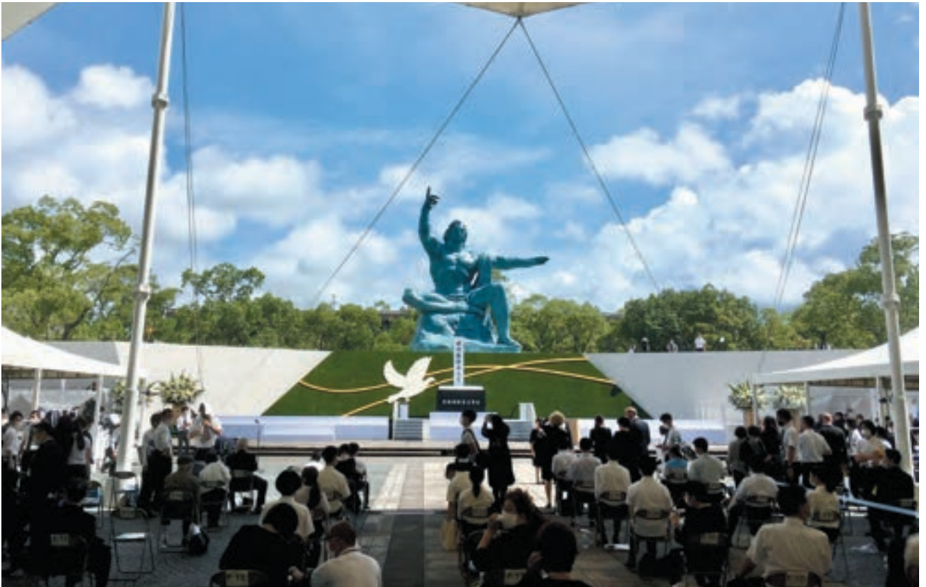
2本の交差する黄色い線で、平和な世界を願う被爆者とその思いを受け継ぐ若い世代を表現し、平和を象徴する白い鳩が羽ばたく、美しいデザイン。