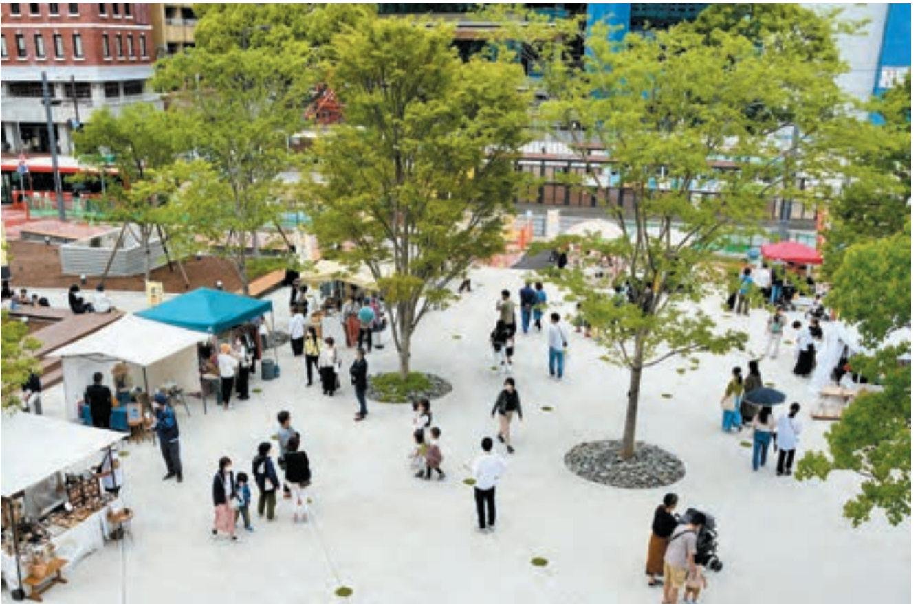
オープン以来、イベントや日常的な休憩、待ち合わせ等に活用されている。 公園を自由な空間として人に開放していくために、管理者側の考え方や仕組みを変えていく必要がある。