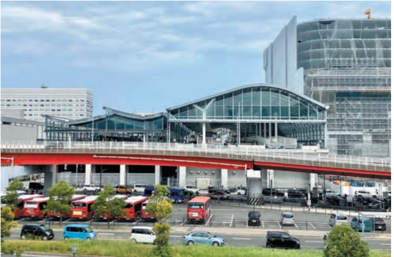
在来線駅舎（左）と新幹線駅舎（右）を一体的に、ひとつの駅舎としてデザインしている。これほど在幹が一体となった駅舎は、おそらく日本で初めてだろう。