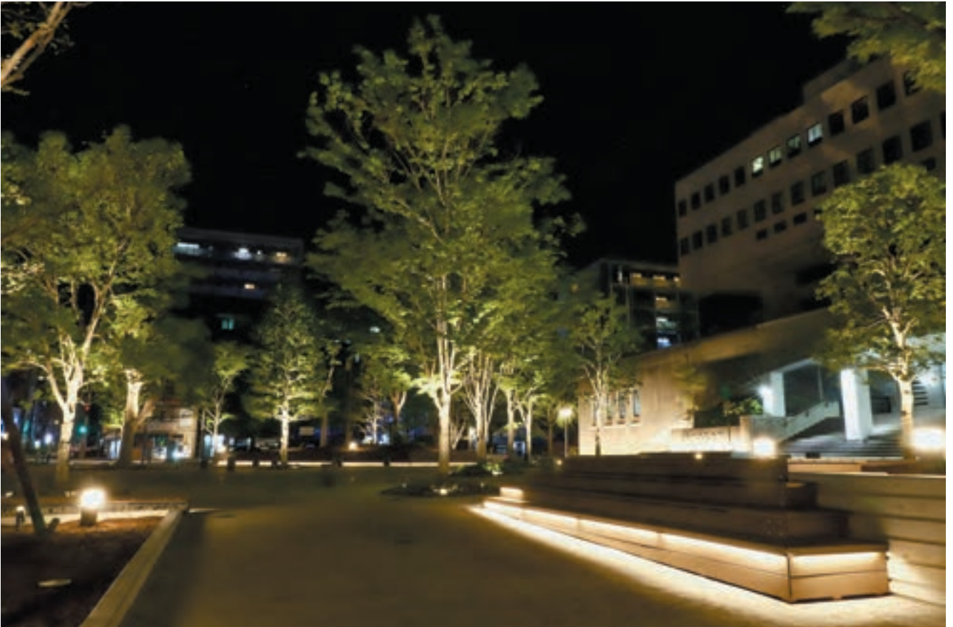
夜間にもあたたかい雰囲気のある広場となるように照明をデザインしている。