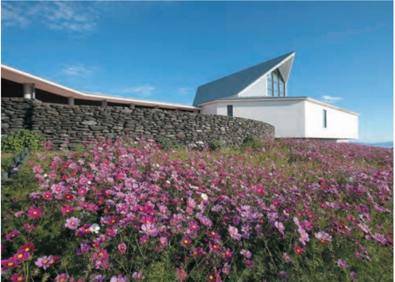
子どもたちが苗植えをしてくれたコスモスは、秋に満開となり、文学館を訪れる人々の記憶に残りました。