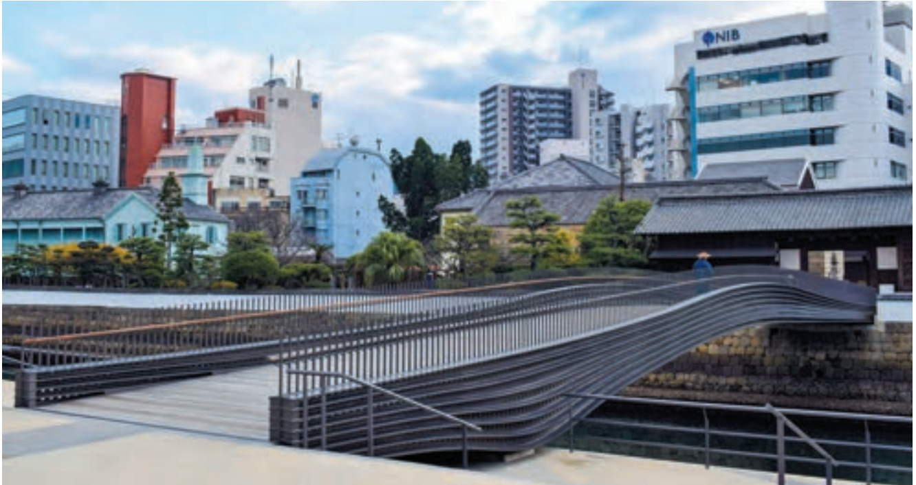
出島を尊重するデザインとしながら、出島側には荷重をかけずに、ただ触っている（乗っている）だけ、という最先端の技術でつくられた出島表門橋。

都市景観大賞2021都市空間部門大賞（国土交通大臣賞） 土木学会田中賞2018 日本建築美術工芸協会ACA賞2018 長崎市都市景観賞2019（公共施設部門）