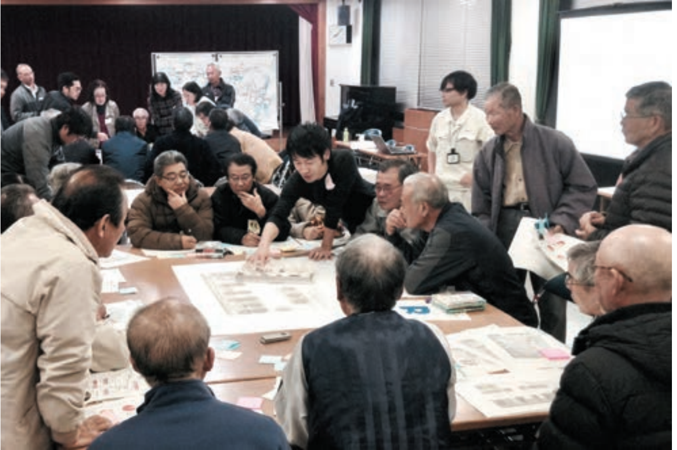
九州大学大学院生からの提案をたたき台にして市民の皆様に見聞交換していただいた。模型を囲むことで、より具体的な意見をいただくことができた。