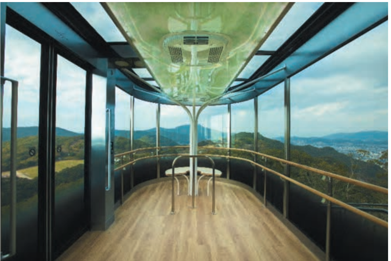
車両内部も稲佐山の自然環境と呼应したデザインとなっている。