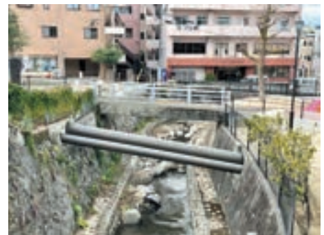
小規模事業の例：天主公園横水道管塗装

担当課の職員が示す図面や資料、施工現場に対して指導、助言を行いながら、デザインの指導を行っています。塗装色の選定や設置位置等の検討を行ってきました。協議は原則として現場で行い、ほとんどの場合1～2回で終わります。