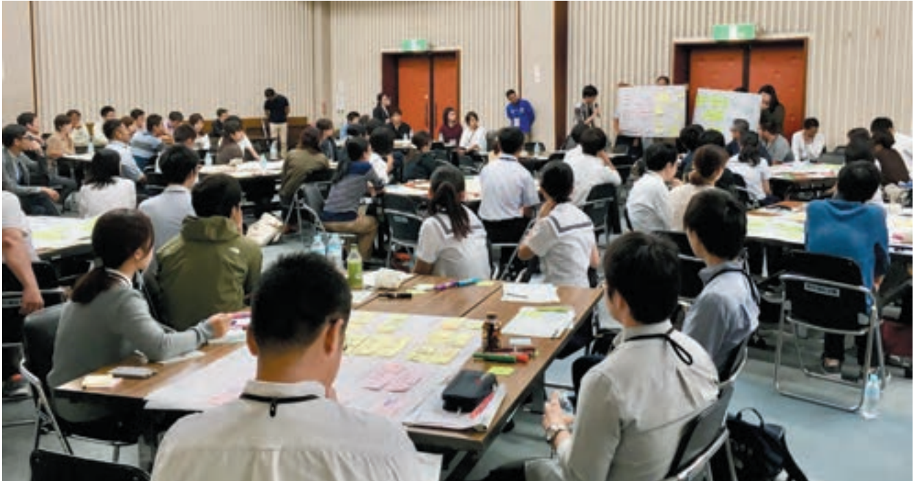
市民ワークショップには中学生や高校生も含めて多くの方に参加いただき、新庁舎について熱心にご提案いただきました。