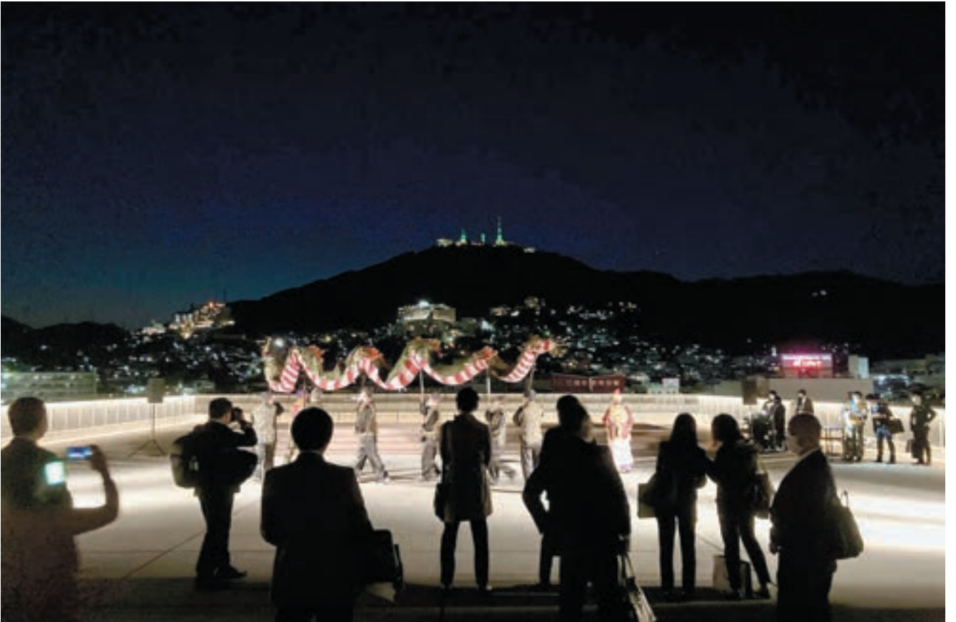
デザイン調整の成果のひとつとして出島メッセ長崎の屋上空間が活用できるように整備され、長崎ならではのアフターコンベンション企画が実施されている。