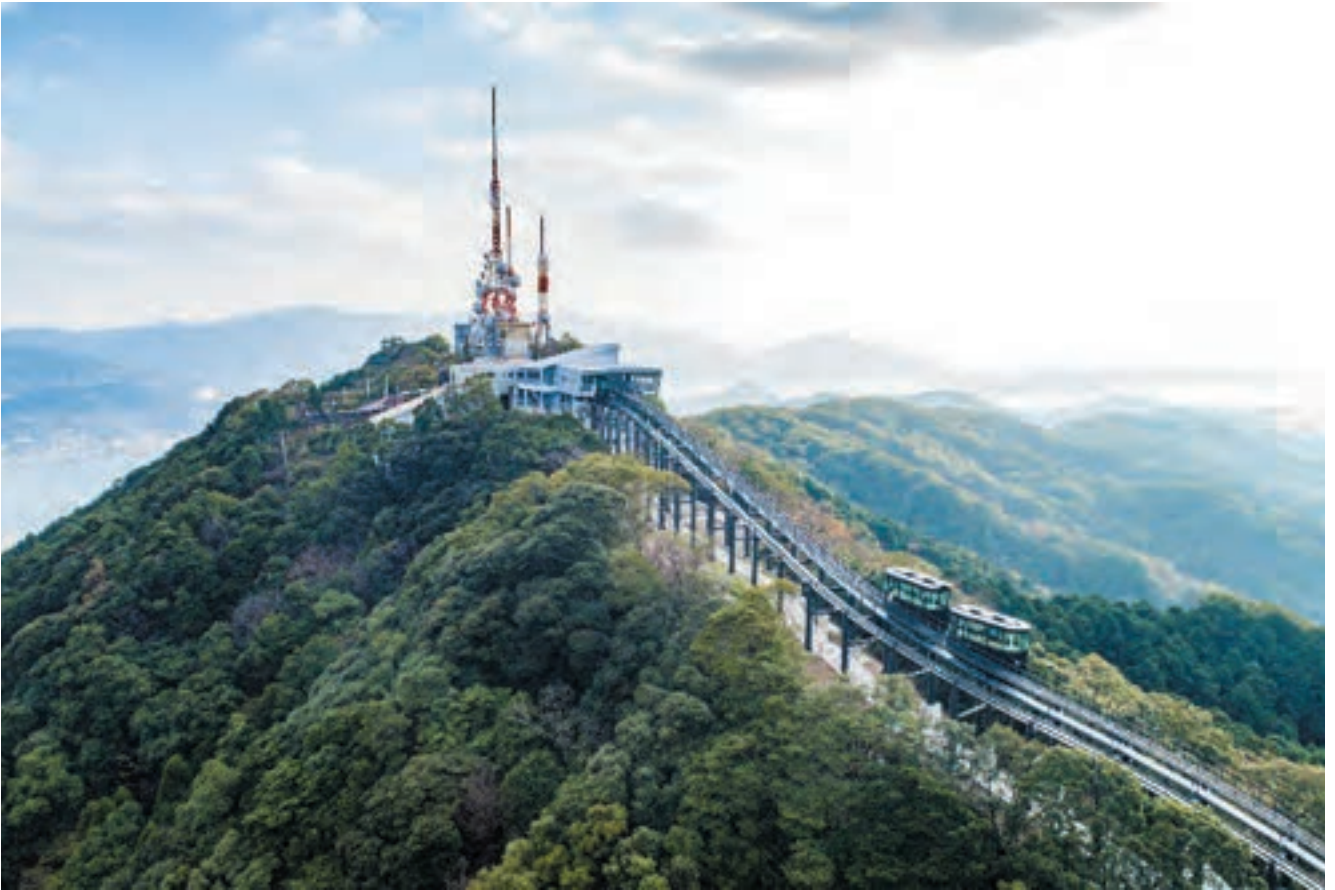
稲佐山の自然環境や海への眺望を移動しながら体験できる。