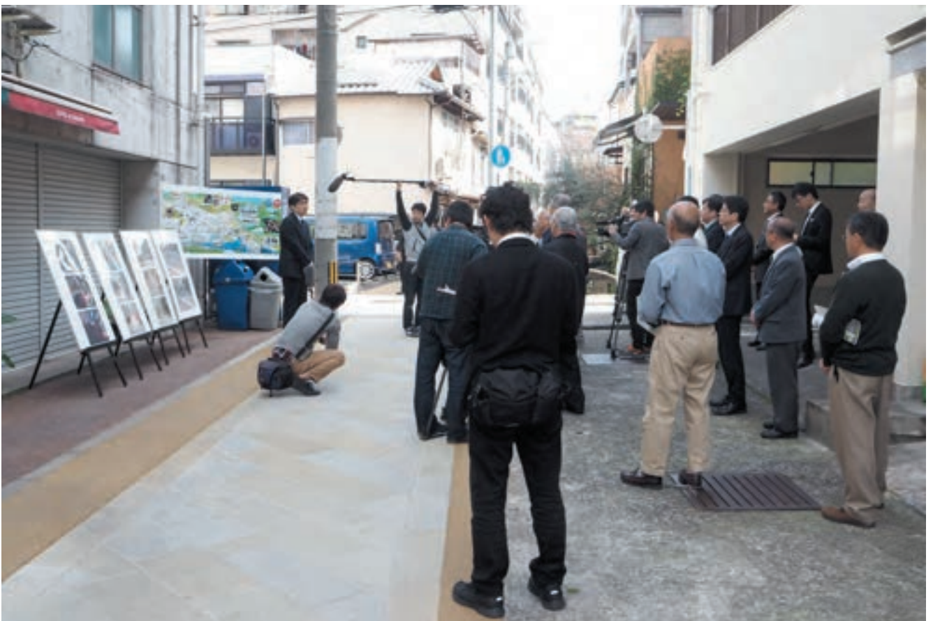
地域の皆様と市長をはじめとする職員で開催した完成式典の様子。地域の方から「ありがとう」と言われた担当係長の笑顔が印象的でした。