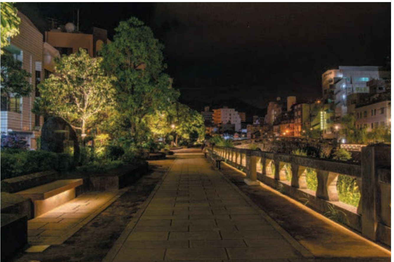
眼鏡橋付近の中島川プロムナードの夜景