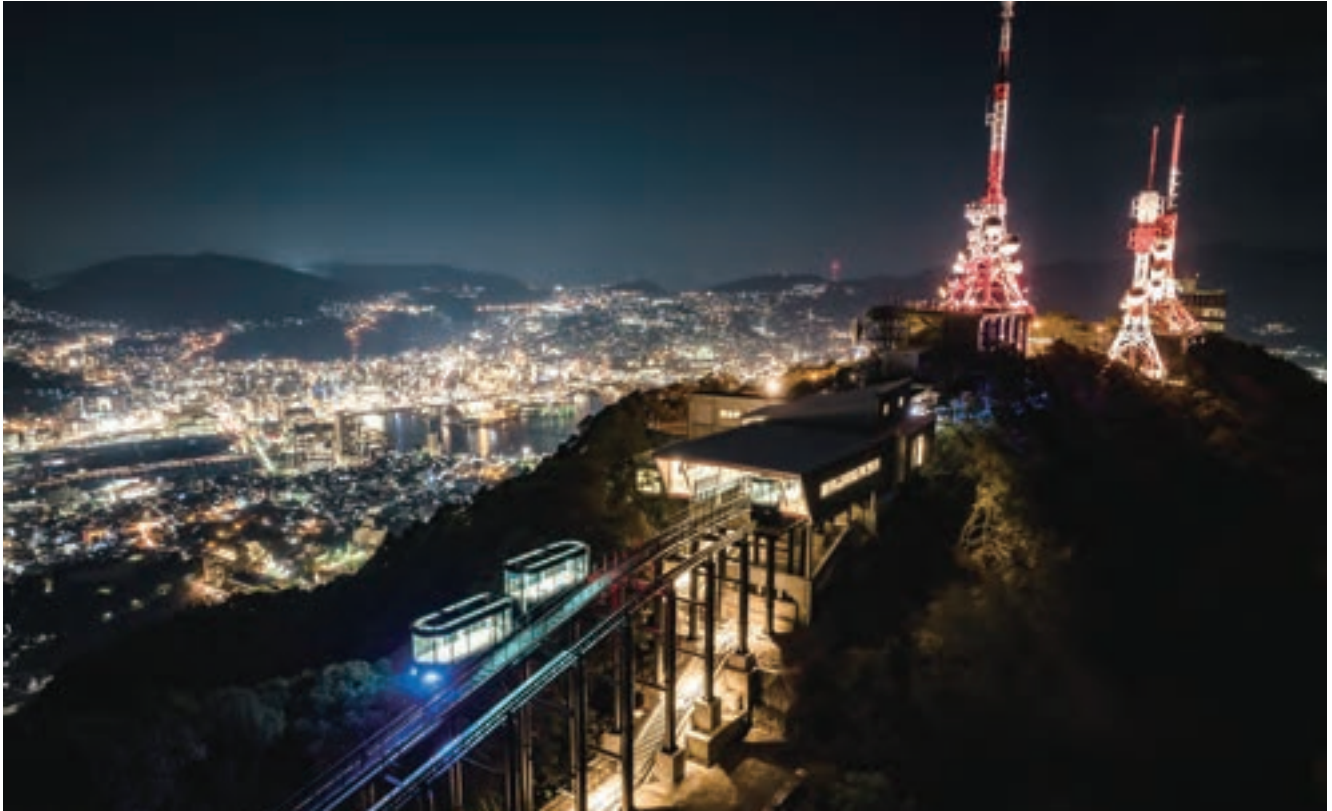
夜間のライティングも含めて車両、駅舎、軌道、軌道下遊歩道等を一体的にデザインした。