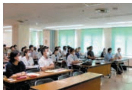
職員研修プログラム

職員研修所が企画、実施している1～10年目の職員研修プログラムにおいて、長崎市の景観まちづくりについて講義を行なっています。長崎市が進めているまちづくり全体の流れを理解していただくとともに、先輩職員たちがそれぞれの仕事で創意工夫を行い、達成感ややり甲斐を感じていることを知ってもらうことで、自分たちの仕事に対するモチベーションを高めてもらうことを目標としています。社会やまちはまだまだ良くなる、という希望を職員自身が持っていることが大事だと思っています。