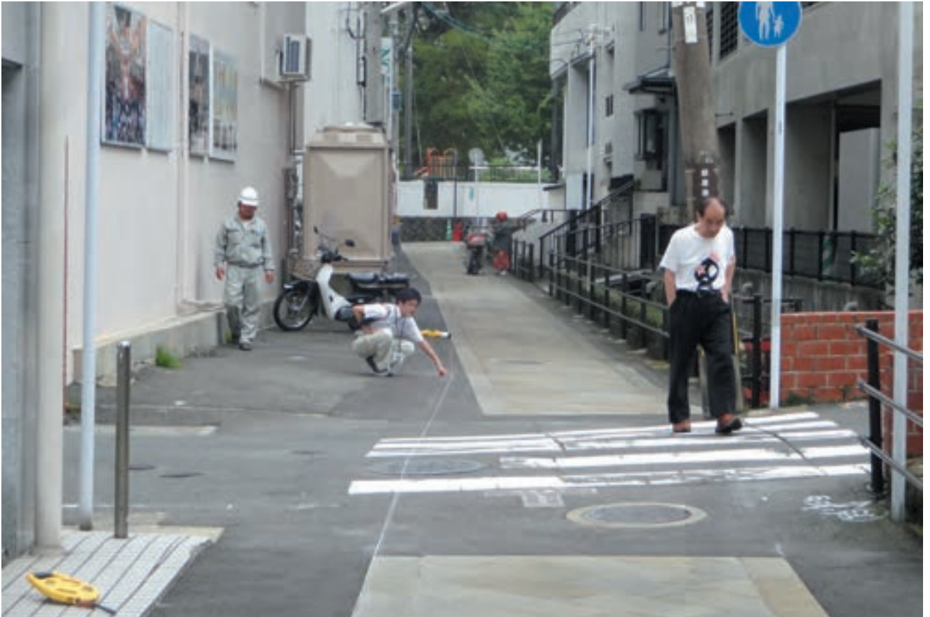
前年度までに整備された区間は、年度ごとの整備範囲しか念頭になく、通り全体を考えて施工されていなかった。