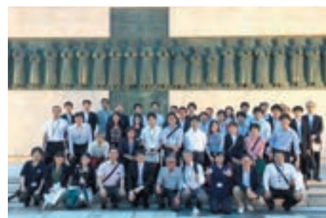
景観専門監プロジェクトさるくツアー

会議室での講演だけでは、特に事務職員には内容がわかりづらいところもあったため、2017年度には景観専門監の監修プロジェクトの現場を歩いてまわりながら、担当職員が解説をする「さるくツアー」を5回開催しました。現場をみることによって、技術的な検討内容もわかりやすくなります。また、ツアー後の懇親会は、これまで出会うことがなかった職員同士の交流の場にもなり、職員同士のつながりを生み出す効果もありました。