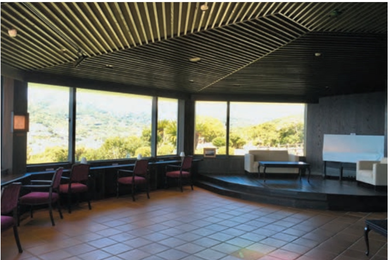
様々なタイプの椅子やテーブルとステージを、そこからの風景体験にあわせて配置している。