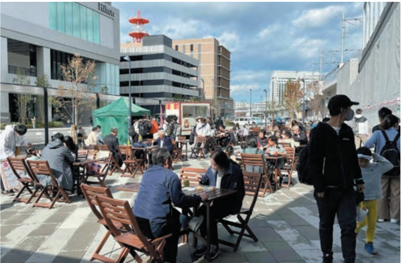
出島メッセ長崎の開業にあわせていなさ口（西口）駅前広場で実施された利活用社会実験。たくさんの来場者があり、利活用に手応えが生まれたことで、「長崎駅周辺まちづくり推進協議会」の設立につながった。