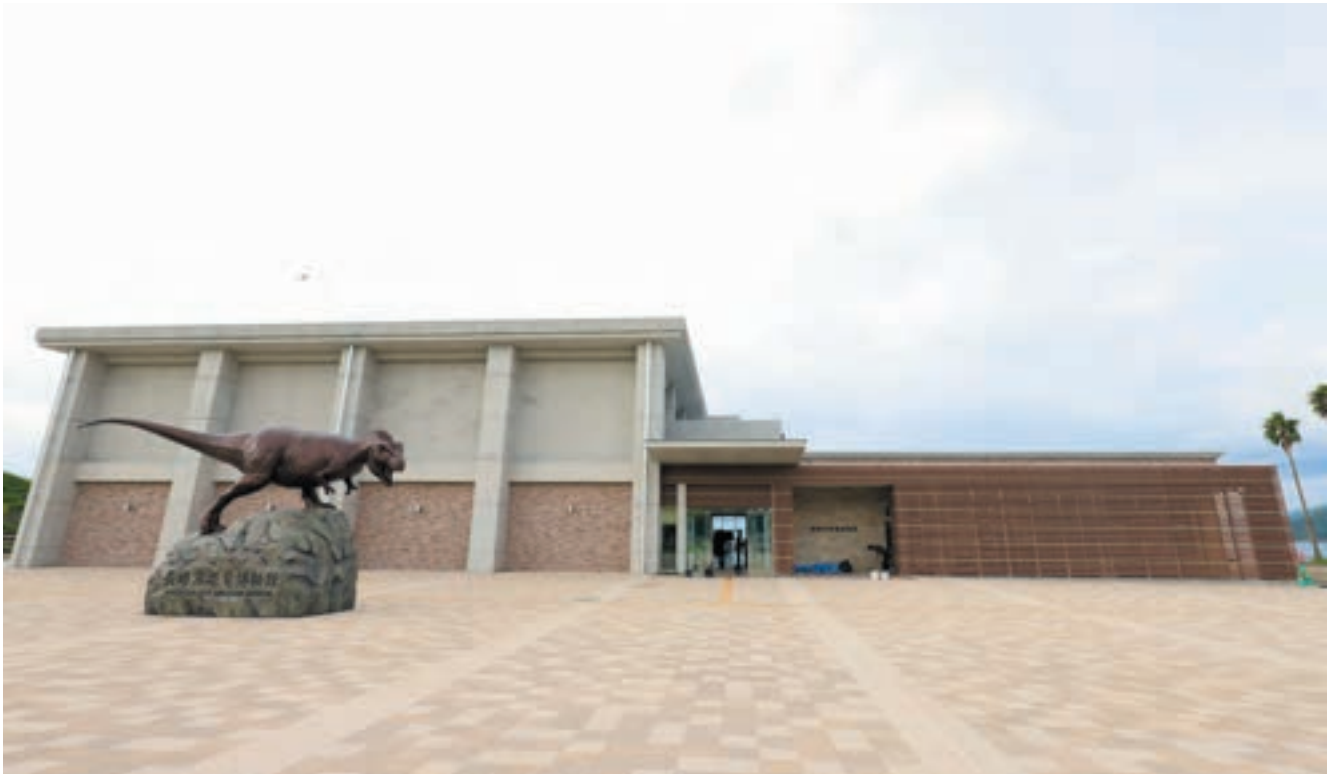
野母崎行政センターから対象敷地に向かう下り坂から見える軍艦島への眺望を守るために建物の左側を高く、右側を低くしている。