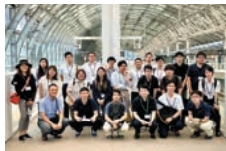
若手職員パワーアップセミナー

職員研修所が企画、実施している「若手職員パワーアップセミナー」で、講義、現場見学、ワークショップの講師を務めています。30歳前後の若手職員から希望者が20名程度集まって開催しています。例えば、「長崎駅前新しい広場ができたなら」「出島表門橋公園を活用してどんなことがしたいか」をグループワークで考え、そのために市役所ができることは何かを考えるプログラムにより政策立案能力（ハード整備やソフト活動だけでなく、それらを実現するための仕組みの提案能力）を高めることを目標としています。これからの時代のニーズに応える職員に必要な能力の育成を目指しています。