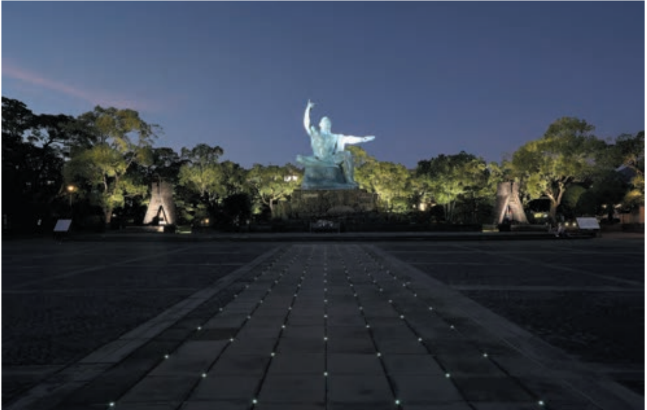
平和祈念像の夜景