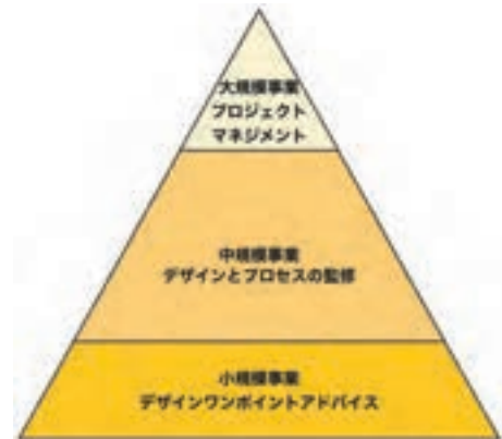
景観専門監の対象事業

景観に関わるものであれば市のあらゆる部局のあらゆる事業に参加します。実際にこれまでの10年間でまちづくり部、土木部といった建設系の部局以外にも文化観光部、企画財政部、市民生活部、水産農林部、総務部、理財部、環境部、福祉部、原爆被爆対策部、教育委員会等の幅広い部局の事業を監修してきました。