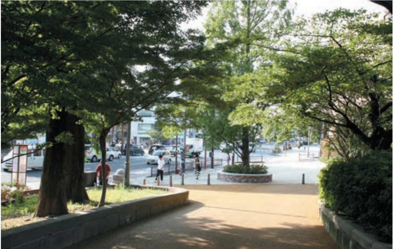
祈りの空間である爆心地を国道側の喧騒と区切るための緑のトンネル効果を残しながら、新たに取得した用地を含めて歩行者通行空間を確保した。