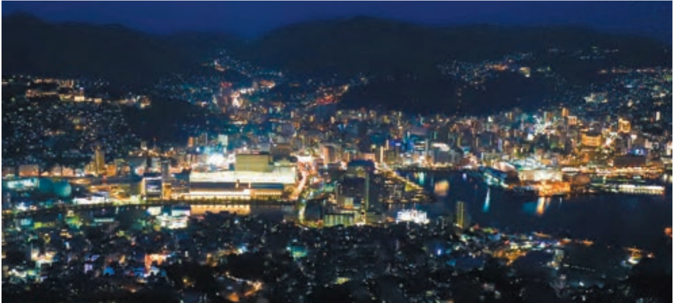
長崎駅周辺全景。膜屋根をライトアップする等、エリア全体として夜間照明に配慮しており、稲佐山から望む夜景に新しいランドマークを与えている。