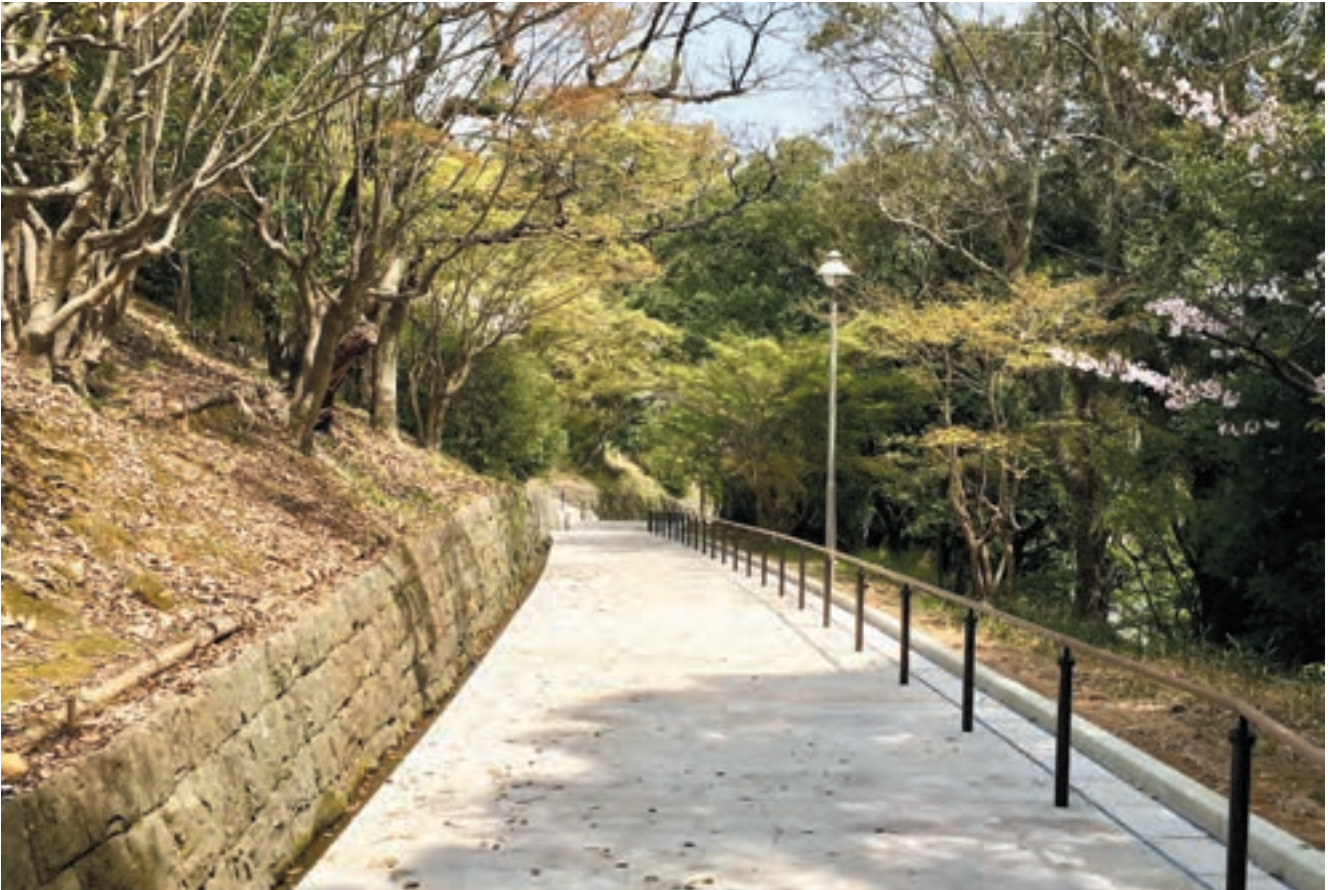
周辺環境との一体性や周辺区間との連続性に配慮しながら舗装や側溝、柵のデザインを検討した。工事をするほどに公園としての完成度が高まるようにと担当職員と協議した成果である。