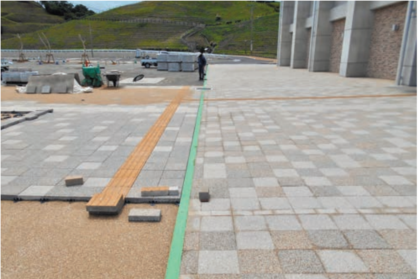
緑のテープから右側が建築の外構工事、左側が公園の工事である。厳しい条件の中、舗装材の仕様や敷き方を揃えるのは簡単そうで難しい。