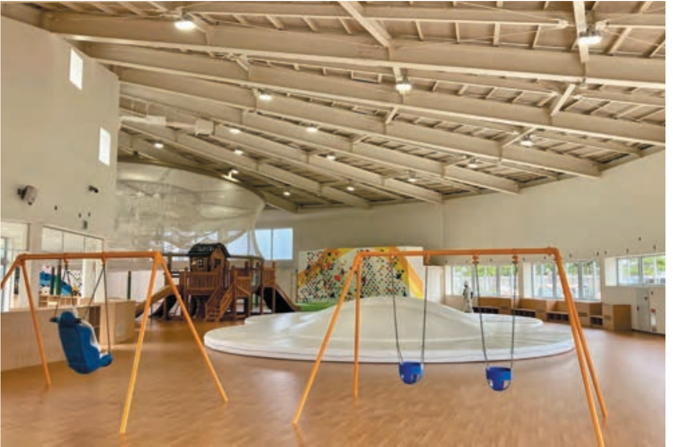
こどもの年齢が上がっていくに従って奥にある遊具にチャレンジできる配置とし、兄弟児を連れてきてもひとつの空間にいれるように配慮している。