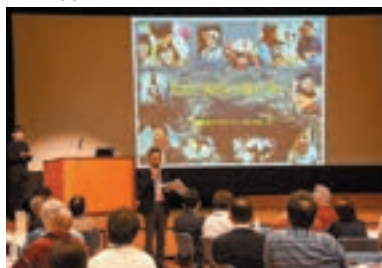
市民ワークショップ