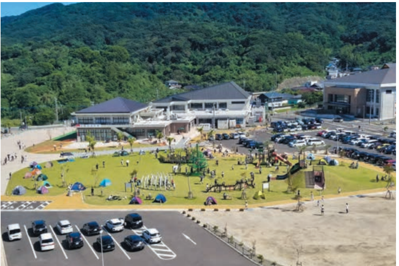
オープン以来、博物館、公園ともに多くの市民にご来場いただいている。子どもたちの笑顔が、私たちにとって何よりのご褒美。