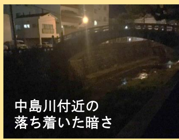
中島川付近の落ち着いた暗さ