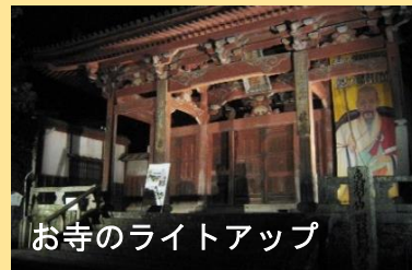
お寺のライトアップ