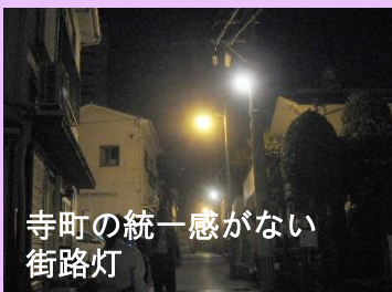
寺町の統一感がない街路灯