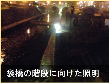
袋橋の階段に向けた照明