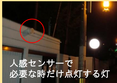
人感センサーで必要な時だけ点灯する灯