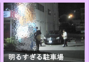
明るすぎる駐車場