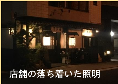
店舗の落ち着いた照明