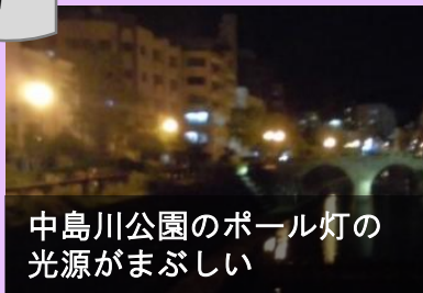
中島川公園のポール灯の光源がまぶしい