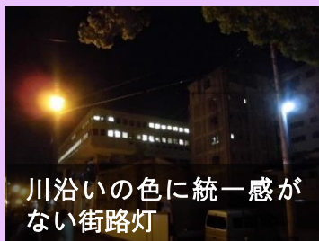
川沿いの色に統一感がない街路灯