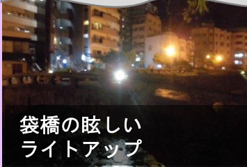
袋橋の眩しいライトアップ