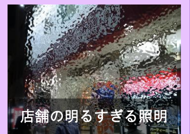
店舗の明るすぎる照明