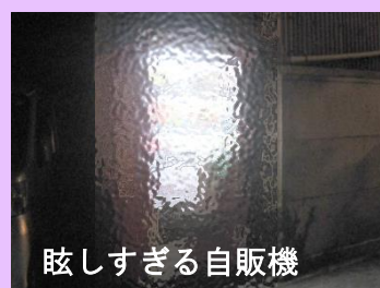
眩しすぎる自販機