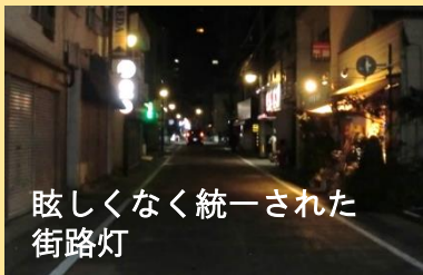
眩しくなく統一された街路灯