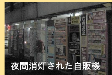
夜間消灯された自販機