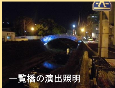
一覧橋の演出照明