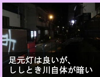
足元灯は良いが、しとき川自体が暗い