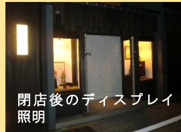
閉店後のディスプレイ照明