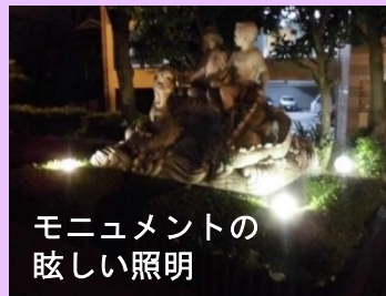
モニュメントの眩しい照明