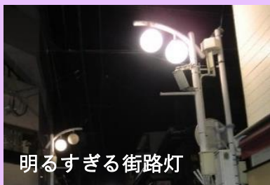
明るすぎる街路灯