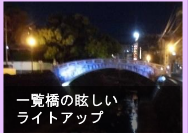
一覧橋の眩しいライトアップ