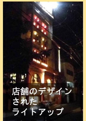
店舗のデザインされたライトアップ