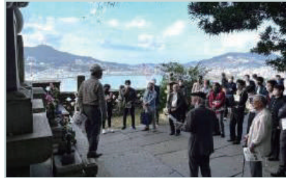
浪の平地区の現地調査