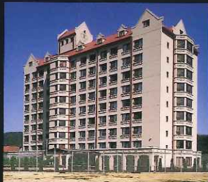
活水学院楠光寮 (小ヶ倉2丁目)