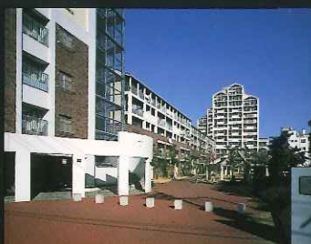
県営大橋団地・市営若葉団地 (大橋町、若葉町)