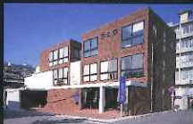
「小さな建物部門」 白髭内科医院 (片淵)