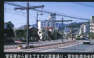
蛸茶屋から新大工までの電車通り・電気軌道中央柱