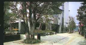
長崎プリンスホテル・ポケットパーク (宝町)