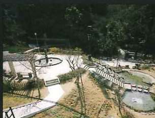
小ヶ倉水園 (上戸町:小ヶ倉浄水場内)