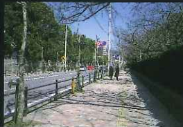
「テーマ部門： 四季プロムナード賞」 文教通り (文教町、大橋町)