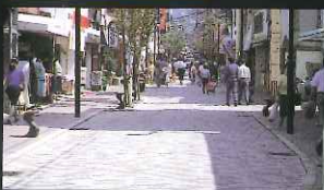
シーボルト通り (新大工町)