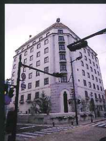
「大きな建物部門」 ホテルモンテ長崎 (大浦町)