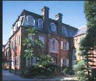
「歴史のある部門」 児童養護施設マリア園 (南山手町)