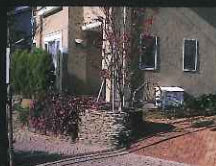
「小さな建物部門」 岩永邸 (小江原町)