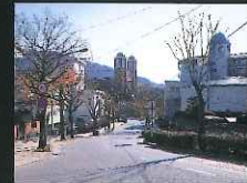
「テーマ部門：四季プロムナード賞」 サントス通り (上野町、橋口町、岡町)