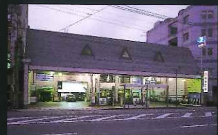
「小さな建物部門」 林兼石油株式会社浦上給油所 (松山町)