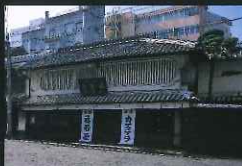
「歴史のある部門」 福砂屋本店 (船大工町)