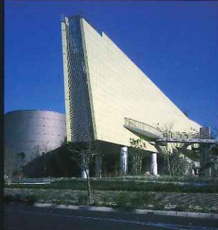
「大きな建物部門」 長崎市科学館 (油木町)