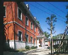
シーボルト記念館 (鳴滝2丁目)