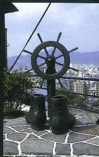
「テーマ部門：歴史ロマン賞」 龍馬のぶつ (伊良林2丁目)