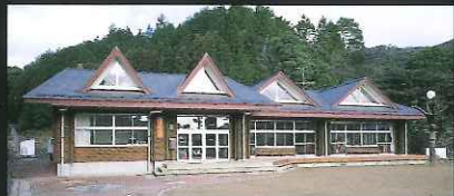
矢上小学校現川分校 (現川町)