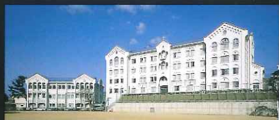
海星修道院 海星学園図書館 (東山手町)