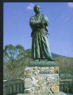
坂本龍馬之像 (銅像) (伊良林3丁目:風頭公園内)