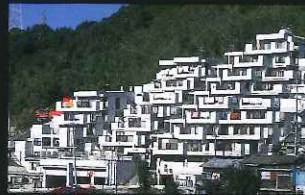
フォーレ三原台 (三原町)