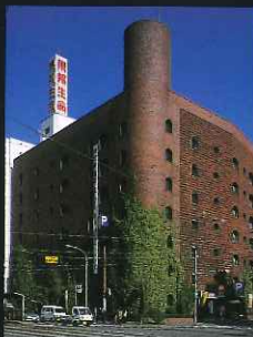
「テーマ部門：建築エコップ賞」 賑橋パーキングセンター (栄町)