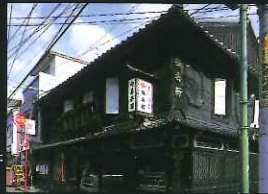
「歴史のある部門」 岩永梅寿軒 (諏訪町)