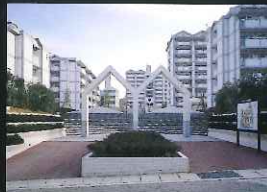
小ヶ倉公営住宅 (告道町)