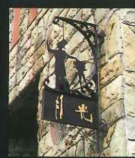
月光スタジオ看板「南蛮ボード」 (桜馬場1丁目)