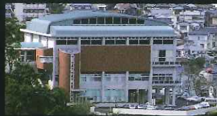
「大きな建物部門」 長崎女子高等学校記念体育館 (中小島2丁目)