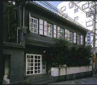
「歴史のある部門」 常岡歯科診療所 (油屋町)