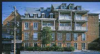
金子建設株式会社本社ビル (松山町)