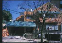
「小さな建物部門」 高野眼科医院 (平野町)