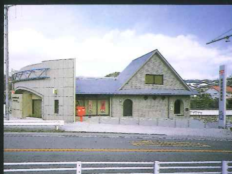
長崎横尾郵便局 (横尾1丁目)