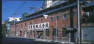
「歴史のある部門」 宝製綱株式会社 (小曾根町)