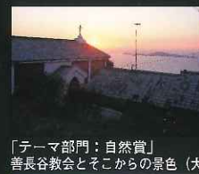
「テーマ部門：自然賞」 善長谷教会とそこからの景色 (大籠町)