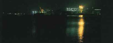
「テーマ部門：ベイスайдシンボル賞」 三菱長崎造船所クレーン・ライトアップ (飽の浦町)