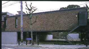
「小さな建物部門」 三宅脳神経外科医院 (若草町)