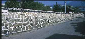
「歴史のある部門」 深堀の石塀群 (深堀地区)