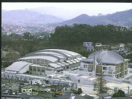
長崎県立総合体育館 (油木町)