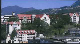
活水女子大学・短大 音楽館・2号館 (東山手町)