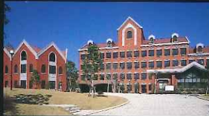
山里小学校 (橋口町)