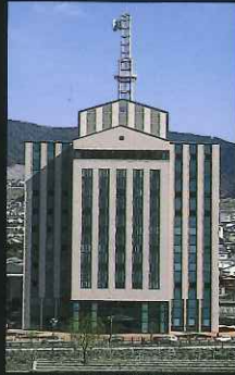
「大きな建物部門」 長崎電気ビル (城山町)