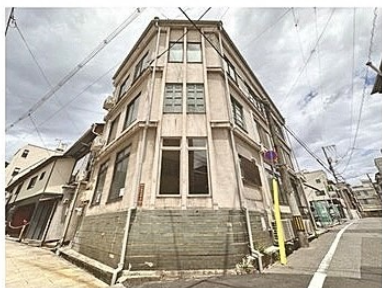
オノツテビルチング