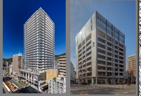
北街区 南街区 (新大工町ファンスクエア) (Jプロ新大工ビル)