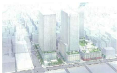
日本橋二丁目地区(東京都中央区) 容積率:800%、700% → 1990% 等

都市再生に貢献し土地の高度利用を図るため、都市再生緊急整備地域内において、既存の用途地域等に基づく規制にとらわれず自由度の高い計画を定めることにより、容積率制限の緩和等が可能。