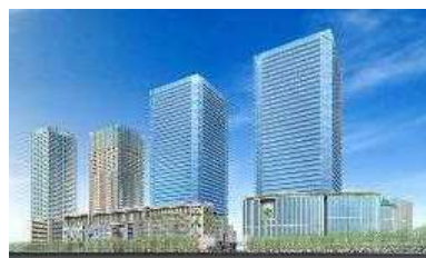
大阪駅北地区(大阪市) 容積率:800% → 1600% 等