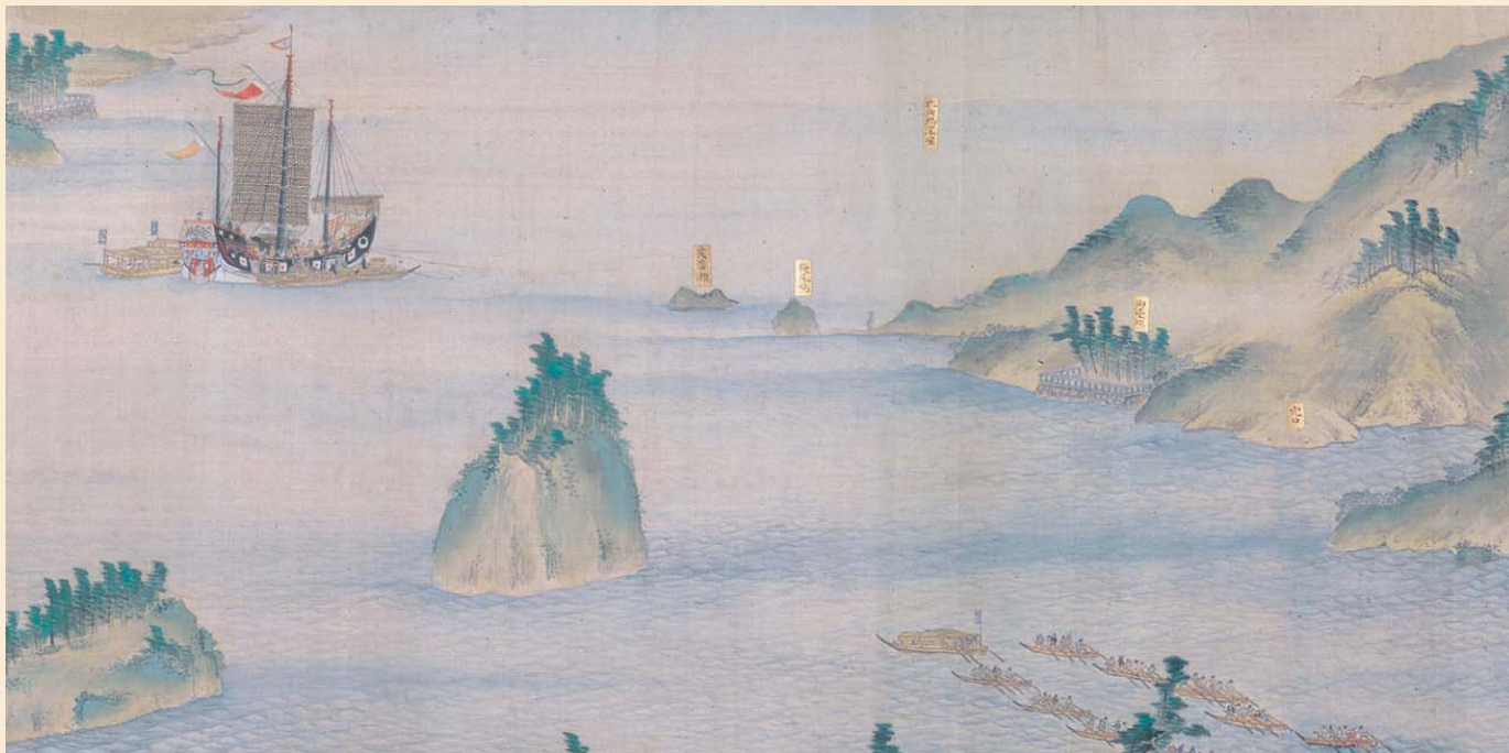
在长崎港入口临时停泊的中国船（【唐馆图卷】部分）石崎融思笔 享和元年（1802年） （1卷 绢本着色42.5×790.0cm）