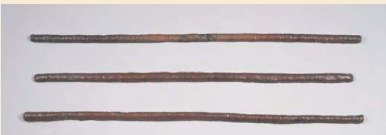
铜条 铜 长约75cm、宽约3cm

贸易的结算，初期的贸易中使用了银，但是之后银的出口受到严格的限制。因此，铜代替银出口，1690年以后成为贸易的主力。这些铜作为结算被称为铜条，在大阪的铜作坊精炼后运到长崎。这些铜条长约21cm、宽约2cm，装在印有百斤（60kg）的木箱。