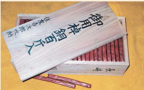
装有60公斤铜条的木箱（复制） 长崎市教育委员会藏 铜 长约21cm、宽约2cm

江户时代初期日本通过中国船出口的主要是银。16世纪后半到17世纪初期，日本是世界上少有的良好品质的银出产国。此外还出口了金和金币，但是元禄金币因为其质量不好，所以没有受到欢迎。因此取代银和金成为出口的主力的是铜和稻草捆包物品。特别是在稻草包里装入沙丁鱼和干鲍鱼、鱼翅等出口。此外还有樟脑（防虫剂等）和海产品、陶瓷器、漆器、铜制品等也大量出口。