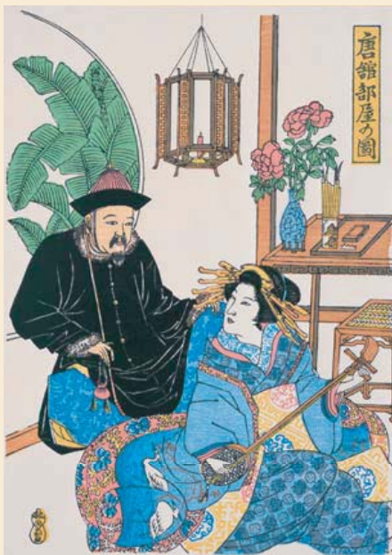
长崎古版画·唐馆房间图 大和屋刊 江户时代后期（19世纪） （1张 纸本色刷34.0cm×25.0cm） （株）长崎文献社藏