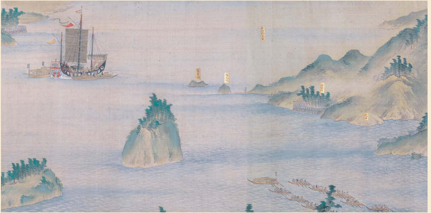
나가사키항구 입구에 임시 정박한 당선 (“당인주거지 두루마리 그림”의 일부), 이시자키 유시 작품, 1802년, (1권 견본착색 42.5cm×790.0cm)