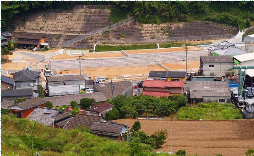
※ 造成工事が進む平間町(小峰地区)の様子を 長崎自動車道から望む