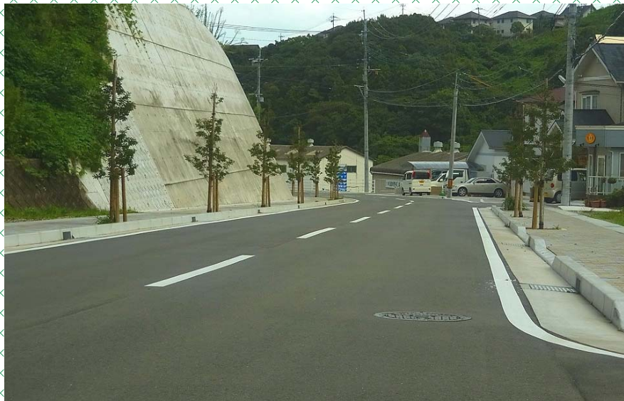
* 都市計画道路現川線と植栽のクロガネモチ