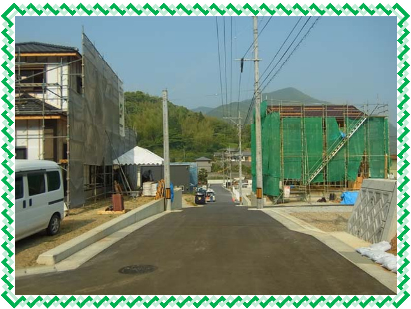
※ 住宅建築が進む平間町(和田地区)の様子