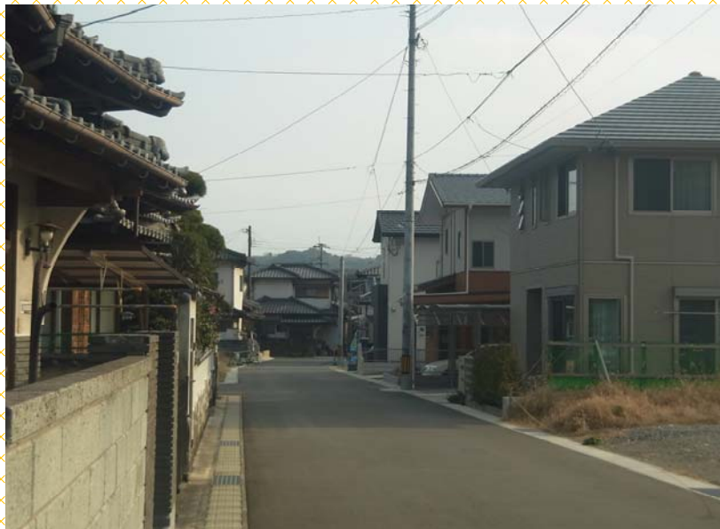
※ 造成が進み住宅が並ぶ東町の街並み(一ノ坪地区)