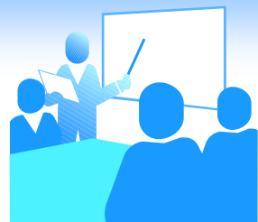
東長崎平間・東地区土地区画整理事業 審議画地状況