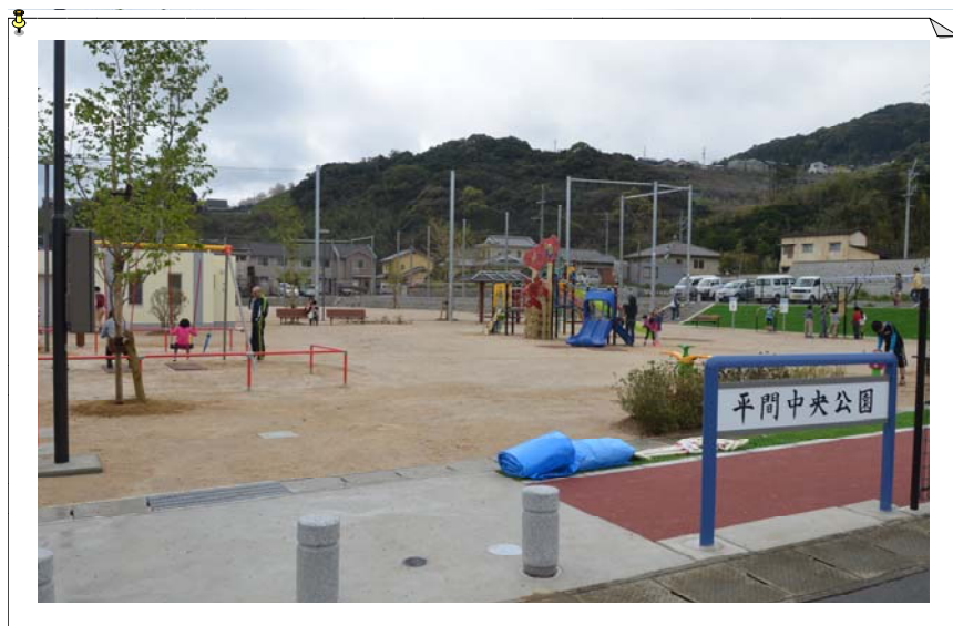
※ 平成26年3月末に開園を迎えた平間中央公園にて 遊具で遊ぶ子どもたち