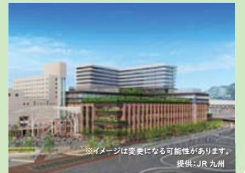
※イメージは変更になる可能性があります。

国際観光都市にふさわしいデザインを取り入れ、商業、ホテル、オフィスなどによる複合施設として開業し、長崎の新たなランドマークとなりました。