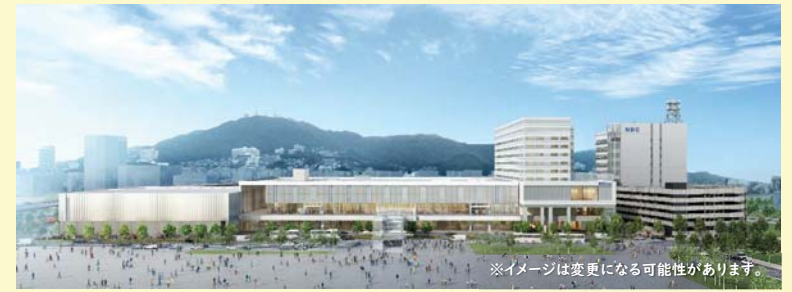
※イメージは変更になる可能性があります。

国際会議や学会を行う「コンベンションホール」やイベント・展示などを行う「イベント・展示ホール」、高級ホテルやショップ、サテライトスタジオなどが複合した施設です。国内外からの多くの人を受け入れて、新たなビジネスや文化を生み出していく交流の拠点であり、最先端の情報や技術、文化にふれることができる長崎らしい場所として「現在のDEJIMA」になることが期待されています。