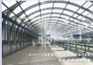
※イメージは変更になる可能性があります。

令和4年9月23日に西九州新幹線(長崎～武雄温泉間)が開業しました。全国の新幹線ネットワークにつながることで、ヒト・モノ・情報の交流が活発になり、長崎がより一層元気になります。