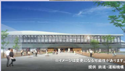
※イメージは変更になる可能性があります。

新長崎駅は日本で唯一の新幹線と在来線の両方が乗り入れる終着駅であり、駅舎からは長崎港が一望できるため海との一体感が感じられる明るく開放的な駅舎となっています。