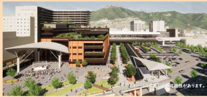
※イメージは変更になる可能性があります。

東口には新たな交通広場や新しい道路が整備され、駅舎へのアクセスが向上します。以前の高架広場の4倍以上の面積となる東口駅前広場は、駅の利用者や長崎を訪れる観光客だけではなく、市民にとってもゆったりとくつろげる憩いの場となるよう整備されます。また、おくんちなどのイベントを開催できる活動の場として楽しむことができます。