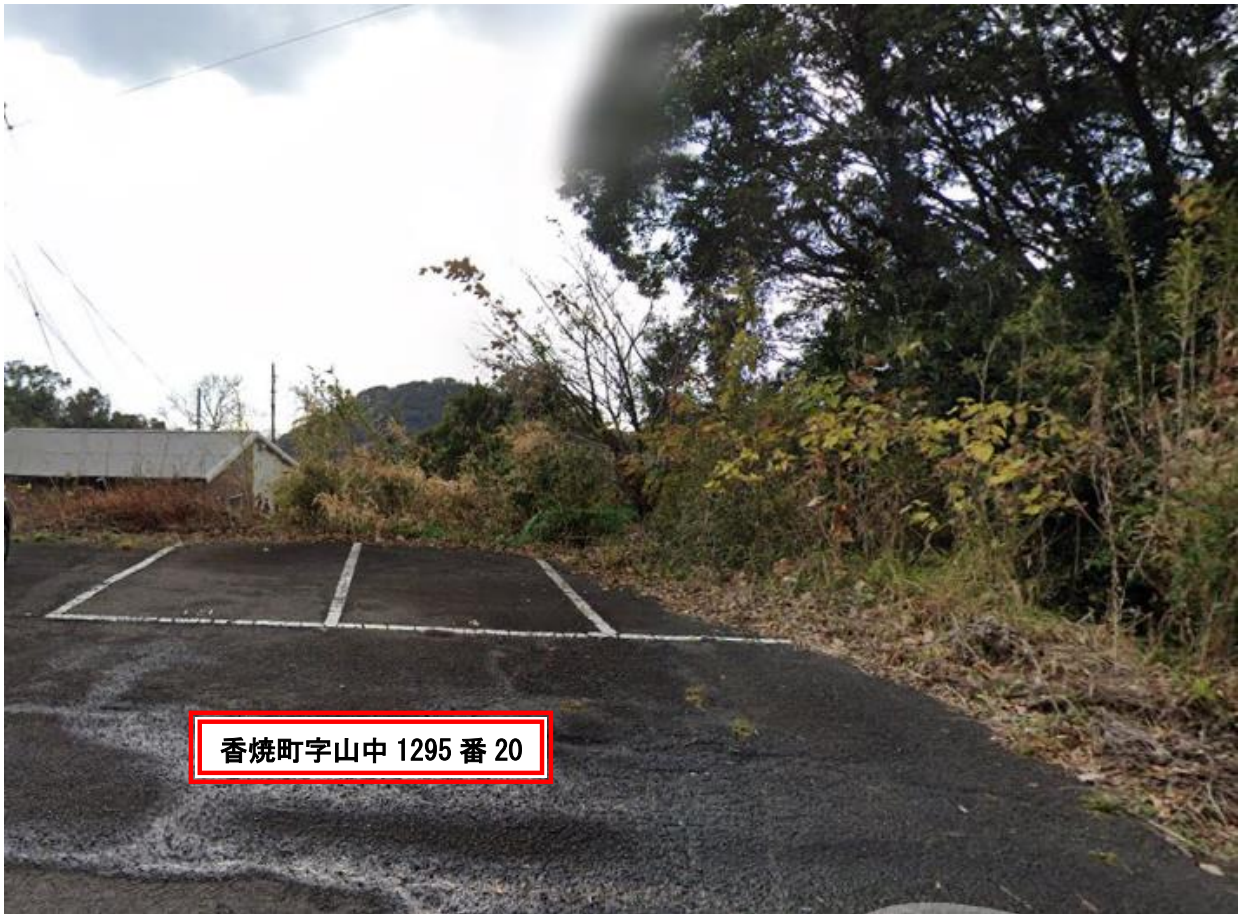
香焼町字山中 1295 番 20