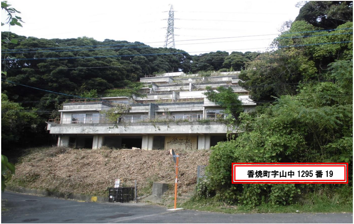
香焼町字山中 1295 番 19