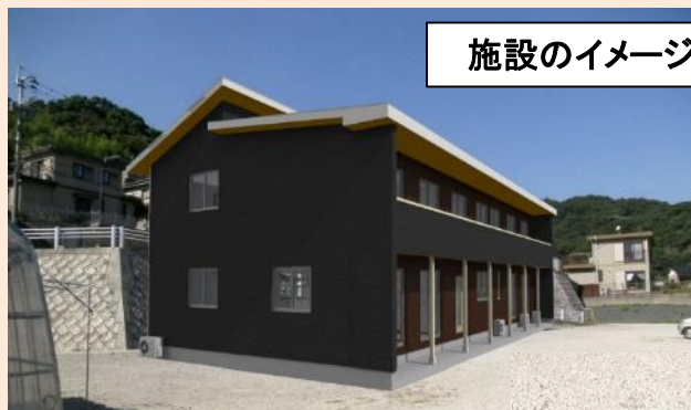
施設のイメージ(古賀町)

障害者の地域生活への移行を促進している中、その受け皿となる共同生活援助事業所(グループホーム)の充実を図るため、施設整備を進める2法人に対し、助成を行います。