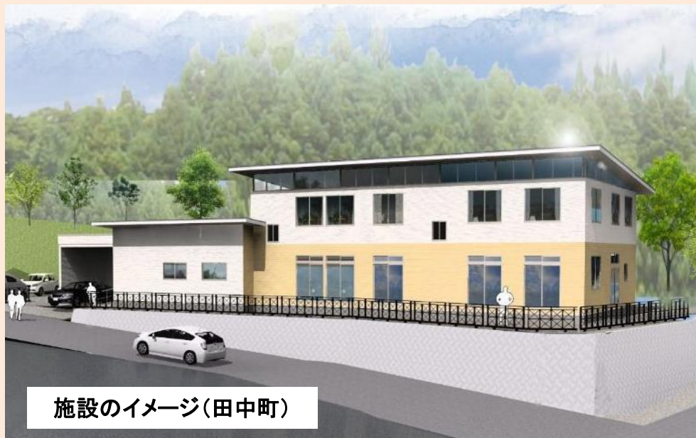
施設のイメージ(田中町)