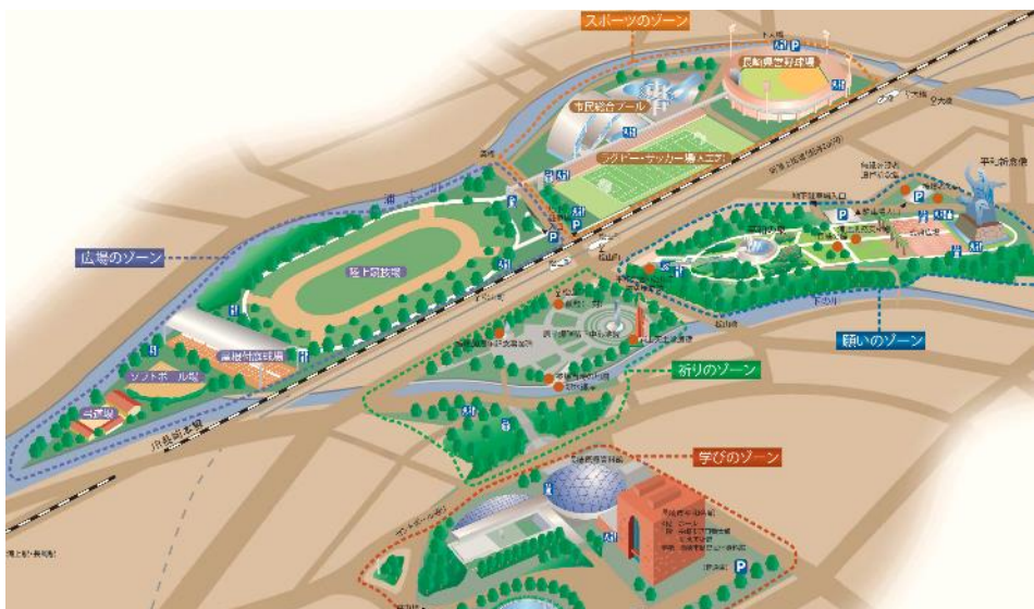
平和公園（ゾーニング図）

道路計画との整合を図るとともに、都市づくりの考え方や周辺の土地利用の変化等も踏まえつつ、 今後の平和公園（西地区）のあり方やスポーツ施設の再配置など について検討し、再整備に係る基本計画を策定します