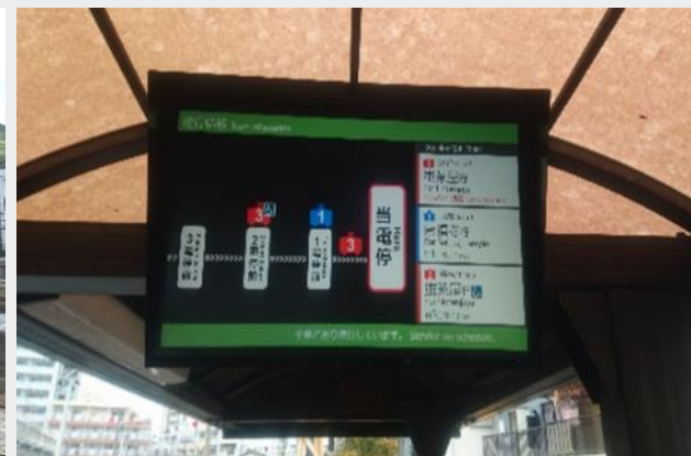
接近表示システム