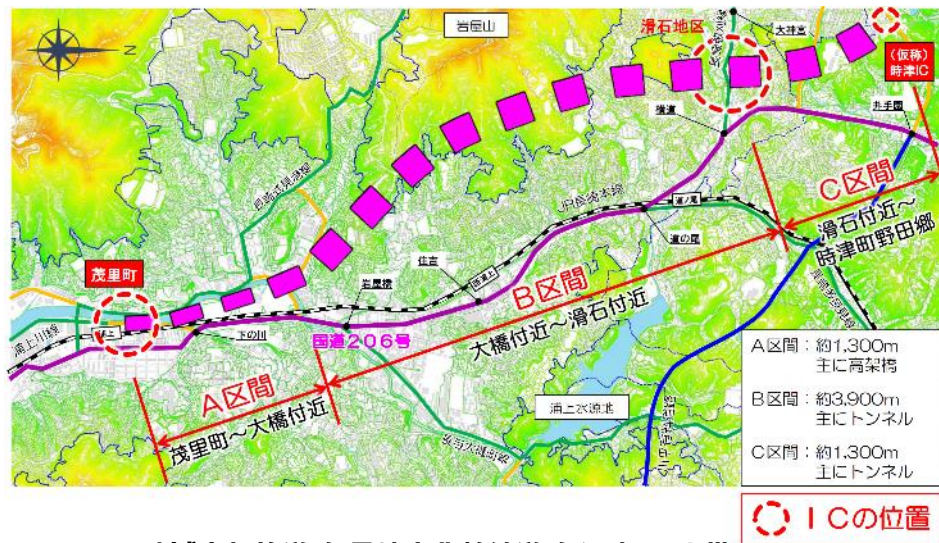
地域高規格道路 長崎南北幹線道路 選定ルート帯 (長崎南北幹線道路ルート選定委員会提言書 (R2.3) より)