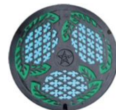
現在設置している デザインマンホール