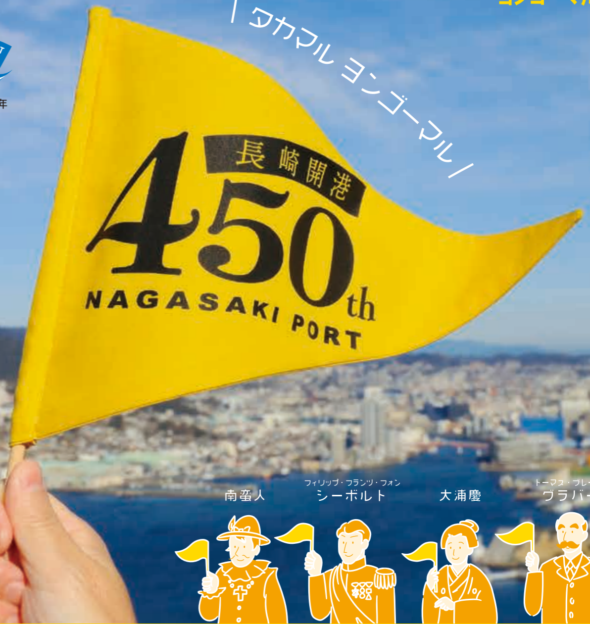
南蛮人 フィリップ・フランツ・フォン シーボルト 大浦慶 トーラス・ブレイク グラバー