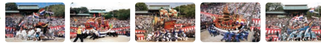
阿蘭陀船(出島町) 唐人船(元船町) 南蛮船(銅座町) 唐人船(大黒町) オランダ船(江戸町)

450年前の開港後、海外の船が長崎に寄港した風景をイメージ。長崎くんちでもおなじみの船が出島表門橋公園に集結します。