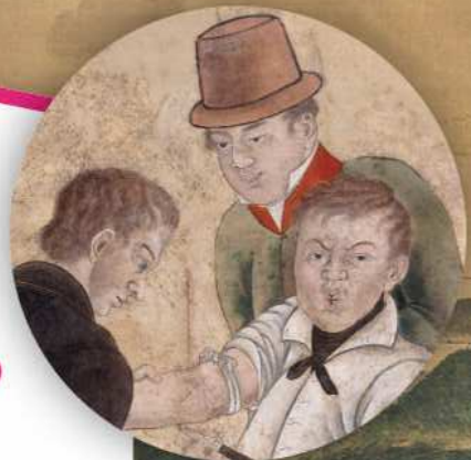
瀉血手術図(部分) 長崎歴史文化博物館収蔵