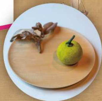
日蘭協業アート作品展示 Craft Runways 2022