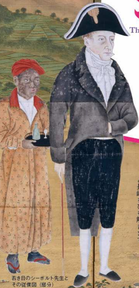
若き日のシーボルト先生と その従僕図(部分) 長崎歴史文化博物館収蔵