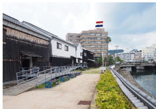
新たに設置する旗竿