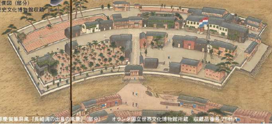
川原慶賀筆屏風『長崎湾の出島の風景』(部分) オランダ国立世界文化博物館所蔵 収蔵品番号7141

また、川原慶賀筆屏風『長崎湾の出島の風景』をもとに、屏風に描かれた出島、新地荷蔵、長崎港など、シーボルトと慶賀が見た往時の長崎の景色や風俗に焦点をあて、シーボルトが滞在した前後の出島と長崎をひも解きます。