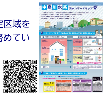
中島川水系ハザードマップ

また、防災講話においてハザードマップの確認方法などの周知や、自治会や地域コミュニティ連絡協議会などと連携して、地域防災マップづくりや地域防災訓練を行い、災害時の対策を図っています。