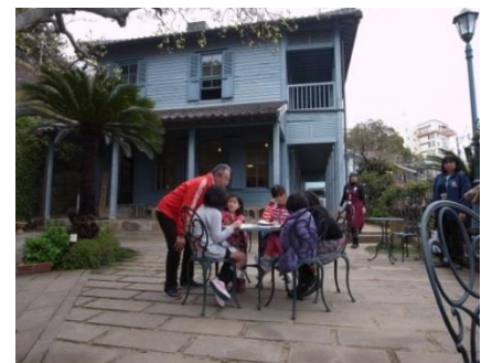
東山手甲十三番館