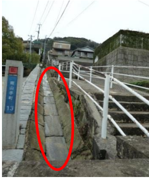
むかし のこ みぞ 昔から残る溝

すいちよく きゅうゆずり は てい ざか えん コース: 垂直エレベーター→旧 榎葉邸→ドンドン坂→グラバー園