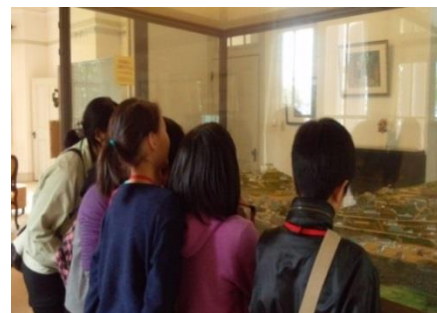
南山手地区町並み保存センター