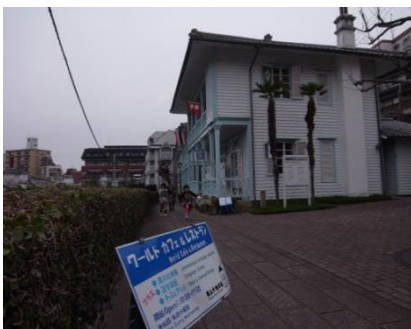
東山手洋風住宅群7棟