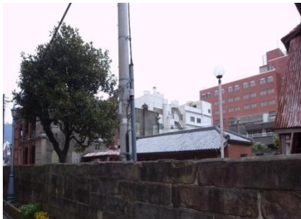
旧長崎英国領事館