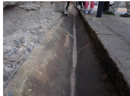
さんかくみぞ 三角溝

それぞれのコースをまわった後は、 あと 南山手レストハウスに みなみやまて 戻り、 もど 各班撮 かくはんと ってきた しゃしん 写真を はくちず 白地図に は 貼 は っていきました。