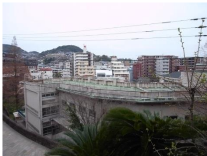
東山手甲十三番館からのながめ