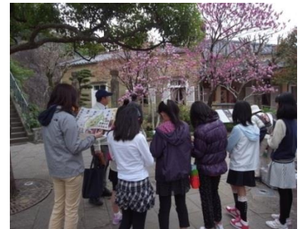
えんない グラバー園内