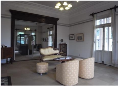
南山手地区町並み保存センター