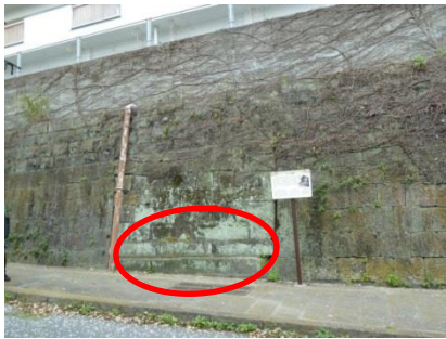
う かいだん 埋められた階段