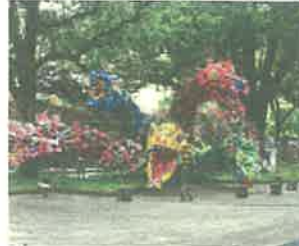
御池の滝伝説アートプロジェ クト (都城市)