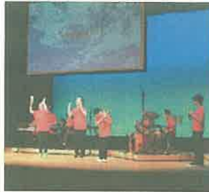
“こころ”のふれあうフェスタ