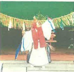
記紀・神話・神楽