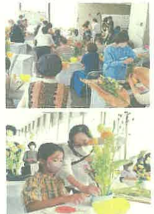
いけばなの祭典（高鍋町）