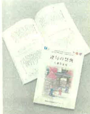
連句の祭典（日南市）