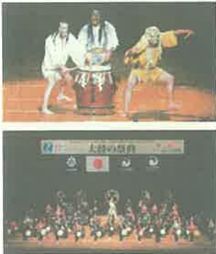
太鼓の祭典（宮崎市）