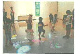
アートフェスティバル