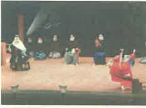
のべおか天下一薪能 (延岡市)