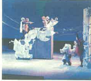
人形劇まつり (延岡市)