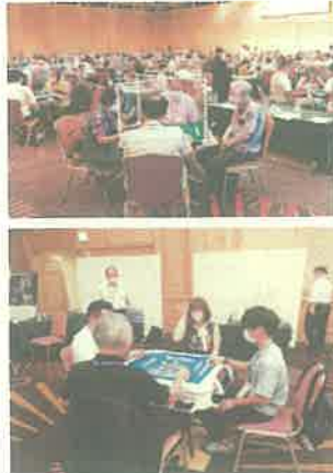
全日本健康マージャン大会 （宮崎市）