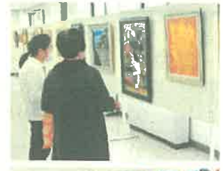
日向のお国自慢大集合！展 (日向市)